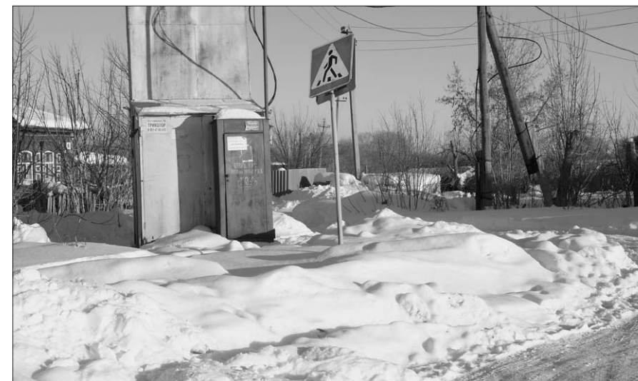
Этот знак на конечной остановке в Тимофеевке водители не замечают

Я помню, как около трех лет назад именно по этим причинам здесь был сбит мой одноклассник. После удара ГАЗели