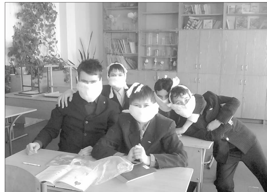
Маски вас не спасут, тогда зачем закрывать красивое лицо?

Ну а теперь самое время сходить на горку! Там так весело! Когда поедете вниз – снимите шапку и, размахивая ею, кричите во все горло: «Эгегей!!! Посторонись! Я тут качусь!» Потом и на каток можно завернуть, только дышать