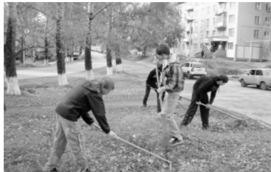
Старания юных тружеников заметили

Всего же в городе на площадках работали 17 вожатых. Каждую неделю команды площадок собирались возле центра внешкольной работы «Ровесник» для участия в ка-