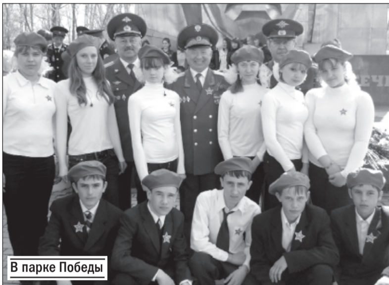
В парке Победы

По инициативе общественной организации ветеранов боевых действий «Гвардия» в нашей школе организован военно-патриотический клуб «Братишка».