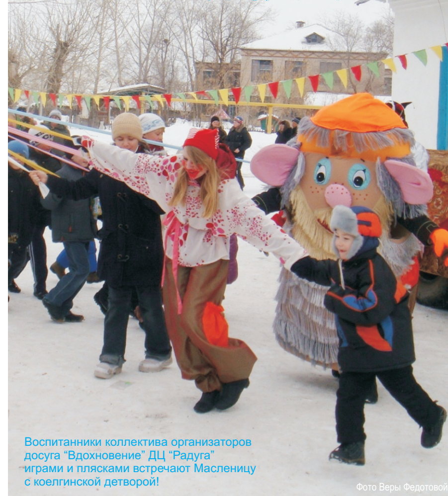
Воспитанники коллектива организаторов досуга «Вдохновение» ДЦ «Радуга» играми и плясками встречают Масленицу с коелгинской детворой!