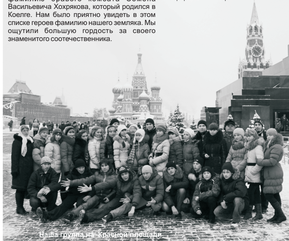
Наша группа на Красной площади