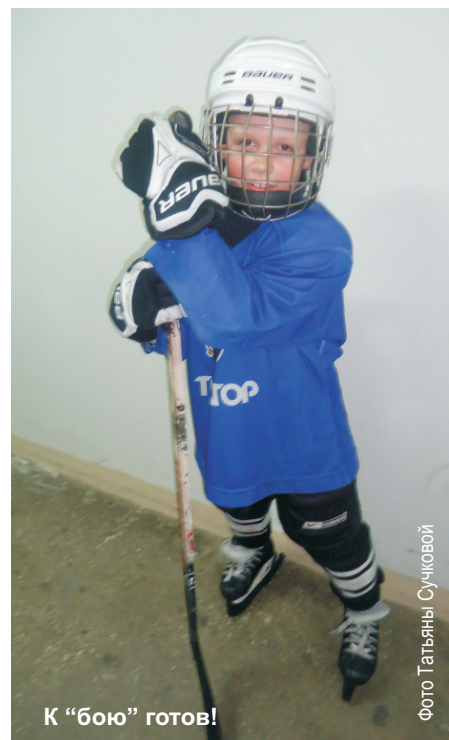
К «бою» готов!

переодеваются, идут на лёд, разминаются, а затем отрабатывают разные упражнения (например, змейка) и, если остается время, играют.