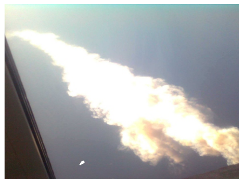
След метеорита над Коелгой.