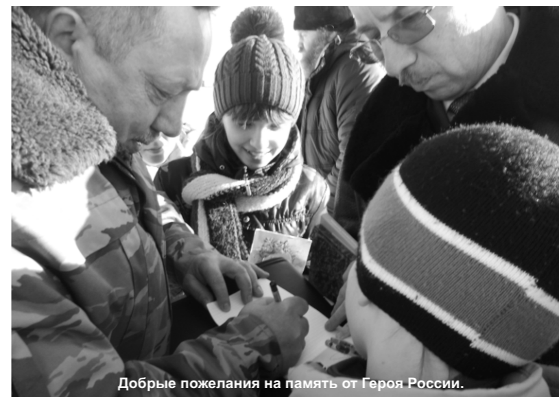
Добрые пожелания на память от Героя России.