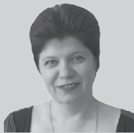
Точка зрения главного редактора