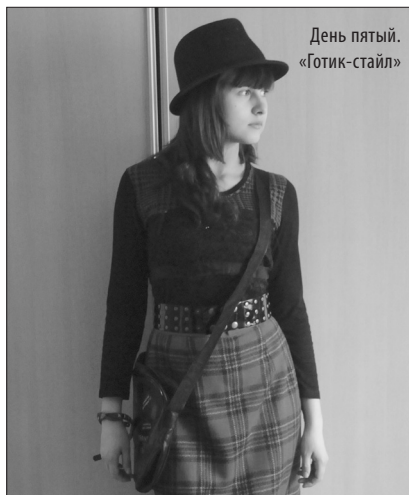
День пятый. «Готик-стайл»