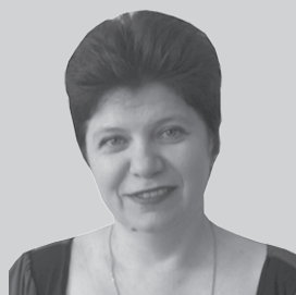
Точка зрения главного редактора