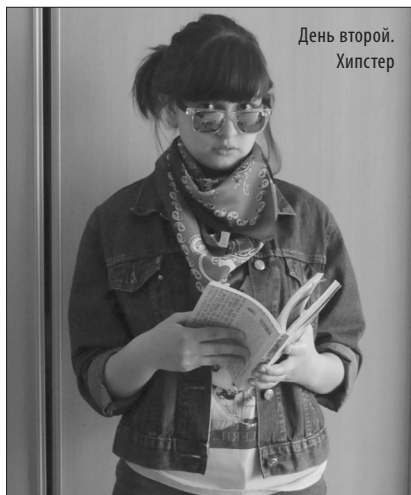
День второй. Хипстер