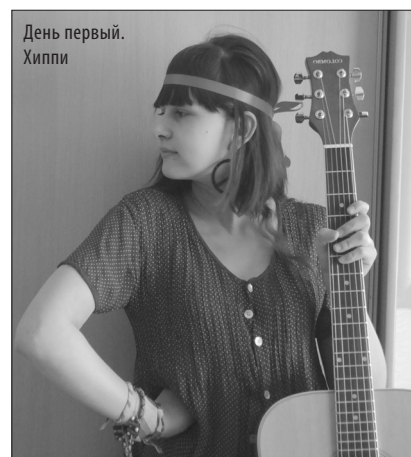
День первый. Хиппи