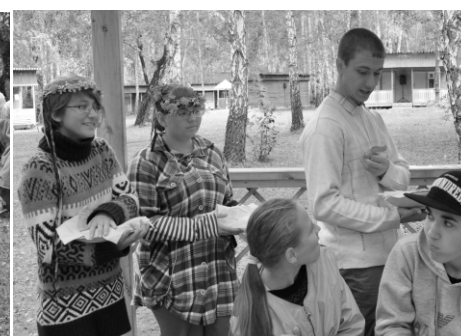
Угощаем коллег домашним салом.