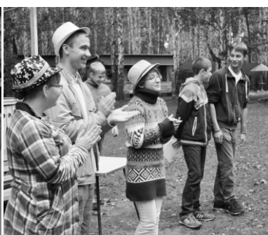
Визитка нашей делегации.