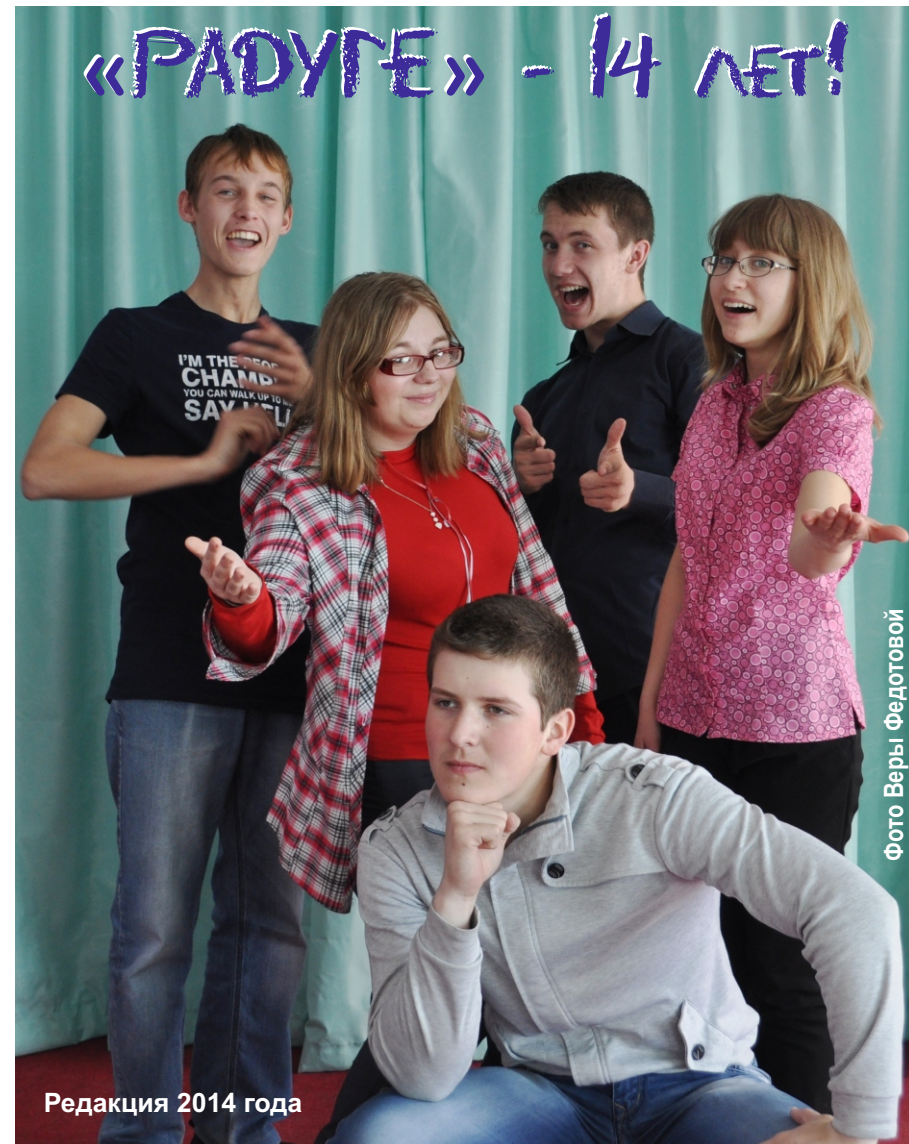
Редакция 2014 года