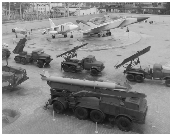
Экспозиция военной техники под открытым небом.

После экскурсии мы поехали в аквапарк и были там целых четыре часа. Перед входом в раздевалку нам раздали пластмассовые браслеты (синие для людей старше тринадцати лет, а красные для более младших), которые мы должны были носить всё время, находясь в аквапарке. Затем мы зашли в огромный зал, где было много горок разных цветов, высоты и сложности. Нам с друзьями больше всего понравилась горка под названием «Анаконда», где надо было скатываться на резиновом круге, по бокам которого были пластмассовые ручки, чтобы можно было крепко держаться во время скатывания по крутому спуску. Скорость была такая большая, что было ощущение, будто сейчас перевернёшься и полетишь кубарем вниз,