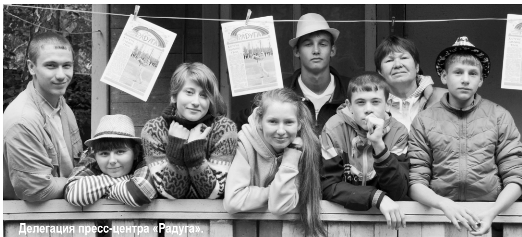
Делегация пресс-центра «Радуга».