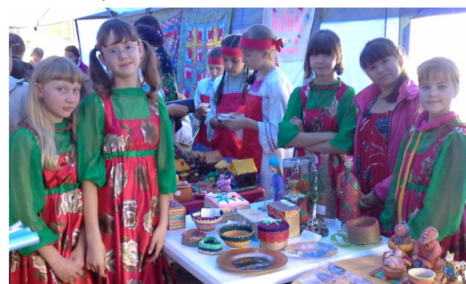
Рукодельницы из коллектива «Разноцветные узоры».

Вероника ВЕЛИКОВА Фотографии из архива ДЦ «Радуга»