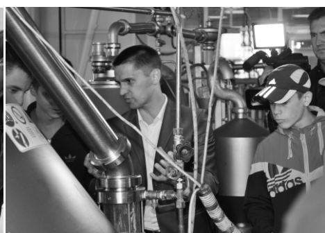
Экскурсия в ХК «Сигма».