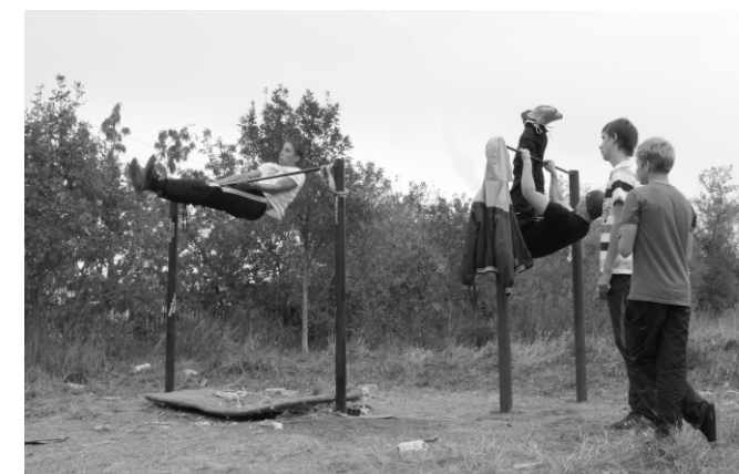
Новые турники на рудничной стороне.

На совхозной стороне тоже есть турники - старые, зато удобные. Рядом с ними в этом году установили новые турники. Они очень удобные. Между ними находится