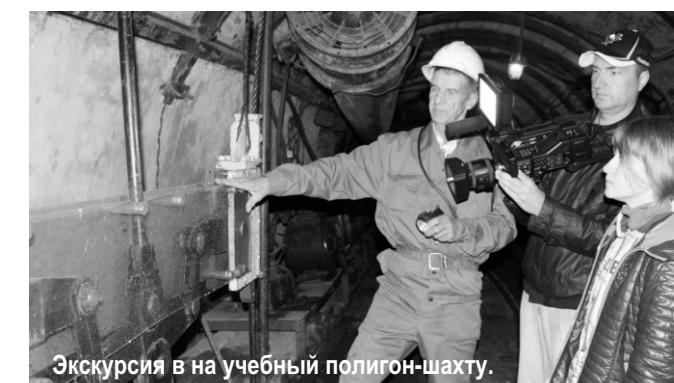
Экскурсия в на учебный полигон-шахту.

Мы вошли в тоннель шахты и стали осматриваться по сторонам при этом внимательно слушая экскурсовода. Первым, что попалось на глаза это ржавые рельсы, которые задело