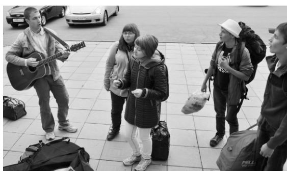
Музыкальное приветствие коллегам.