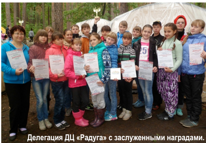
Делегация ДЦ «Радуга» с заслуженными наградами.

Каждый день нам давали задание подготовиться к вечернему мероприятию на определённую тему, например, День народного искусства или День берёзки. Мы всей делегацией очень серьёзно готовились к каждому мероприятию, учили слова и движения. Все наши выступления очень тепло принимались зрителями и членами жюри.