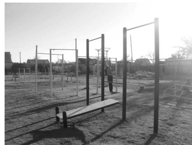
Старая и новая площадки на совхозной стороне.

Дмитрий ПАЩЕНКО