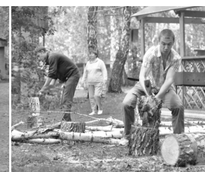
Дрова для вечернего костра.