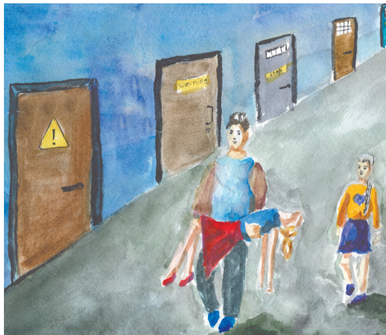
Иллюстрация Валерии МОРОЗНИЧЕНКО, 6 класс первой городской школы