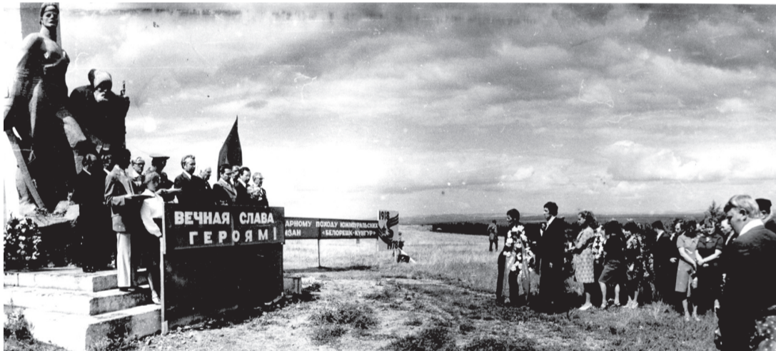
Когда-то эти склоны не знали чудных сосновых насаждений, тех, что мы видим сейчас. На снимке митинг 1978 года