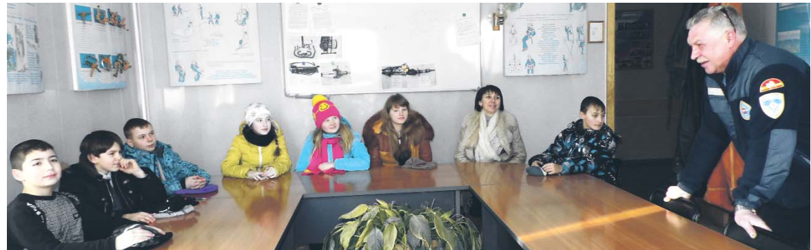
6 «б» класс школы № 1 в гостях у поисково-спасательного отряда

Представим ситуацию: приезжают работники на место аварии, а у человека сильные, глубокие раны. Именно в этой ситуации очень нужна психологическая помощь: чтобы человек не