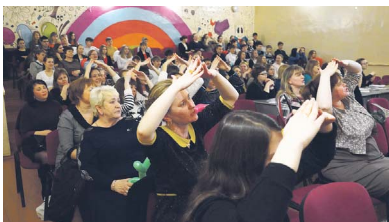
Самое главное — зал принимал на ура!