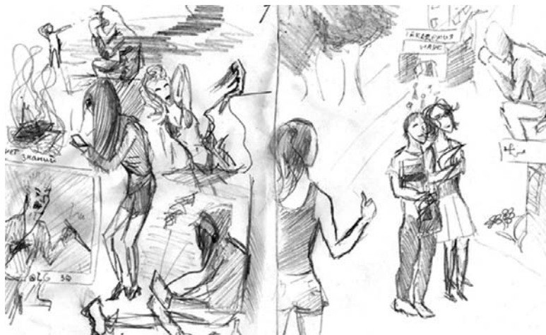
...Но человек остаётся человеком со своим миром чувств, ощущений, миром мечты...