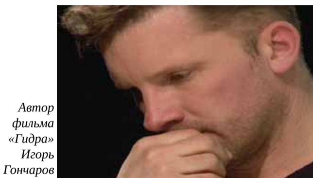
Автор фильма «Гидра» Игорь Гончаров