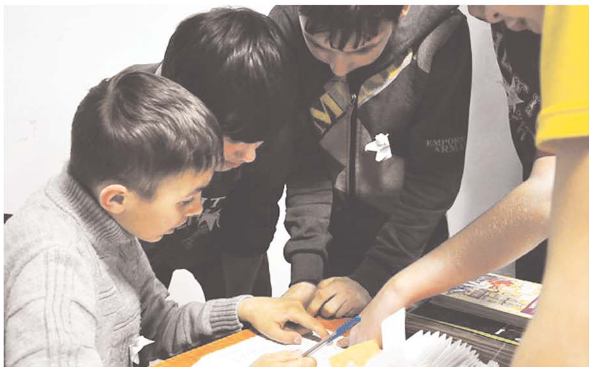
Расшифровка послания для командира