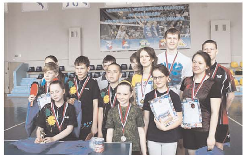
Победители и призёры соревнований