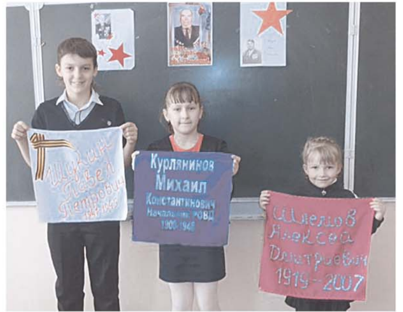
Из памятных платков ребята вязовской школы сошьют знамя к 70-й годовщине Великой Победы.