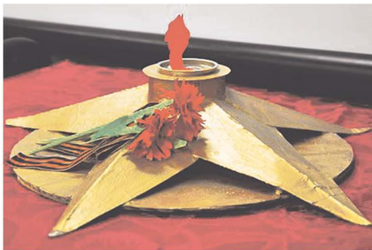
«Дорогами войны» прошли подростки в этот вечер

были заслуженно награждены скромным военным пайком, состоящим из перловки и горячего чая. Но и это ещё не всё! Потом оба отряда отправились изучать технику создания смертельного оружия из бумаги «журавлик» и в этом искусстве превзошли всех мастеров оригами. После запуска в честь наступающего праздника Победы