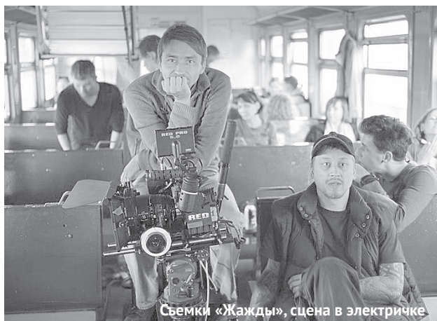
Съемки «Жажду», сцена в электричке

Встреча с таким творческим талантливым человеком была очень интересной и принесла много полезной информации о мире кино и массу положительных эмоций. Будем ждать от знаменитого кинорежиссера новых интересных фильмов и, конечно же, ждем своего земляка снова посетить наш прекрасный город.