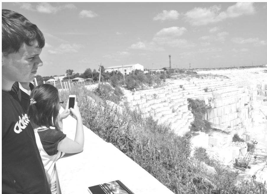
Центральный мраморный карьер. Вид сверху.

Вероника ВЕЛИКОВА, 15 лет, газета «Радуга», Коелга