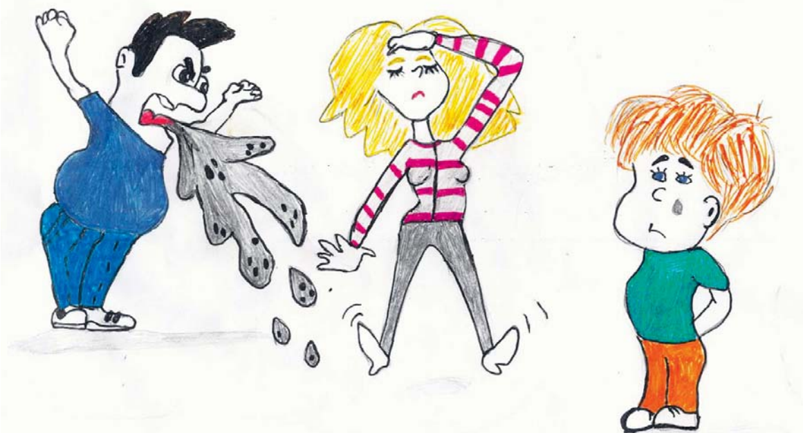
Бранные слова ранят больно душу и сердце всех окружающих

рядом. Многие говорят, что так они выражают свои эмоции. По мнению Лидии Ивановны, в русском языке достаточно слов, чтобы выразить эмоции.