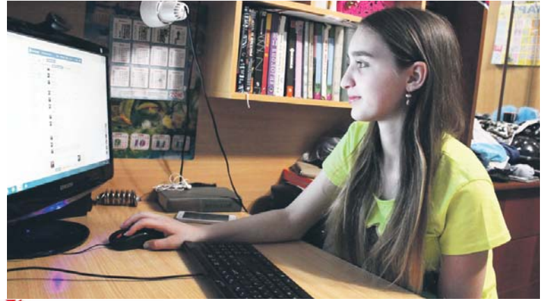
Интернет-друзья — это здорово. Но ещё лучше увидеть друзей наяву

— К интернет-друзьям отношусь очень хорошо, особенно к иностранцам, так как я люблю мир во всём мире. И когда люди с разных континентов начинают