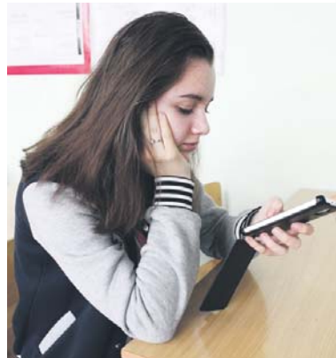
Хорошо, когда есть друг, который может помочь

Мои родители никогда не ограничивали меня в общении. В отношении интернет-друзей они реагируют так же. Ведь это новые знакомства, что в этом плохого? По моему мнению и мне-