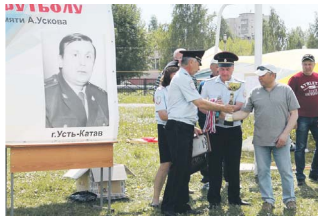
Капитан команды г. Сатки получает заслуженный кубок