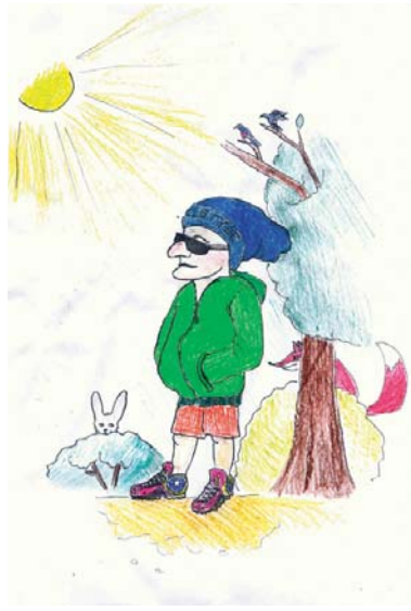
Рисунок Юлии ПЫХОВОЙ.

Вот такая! Вот такая! Песенка! Вот такая! Вот такая! Песенка!