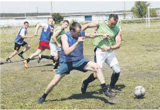
Игра была настоящей, жаркой, захватывающей