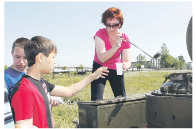
Полевая кухня очень кстати на таком большом турнире