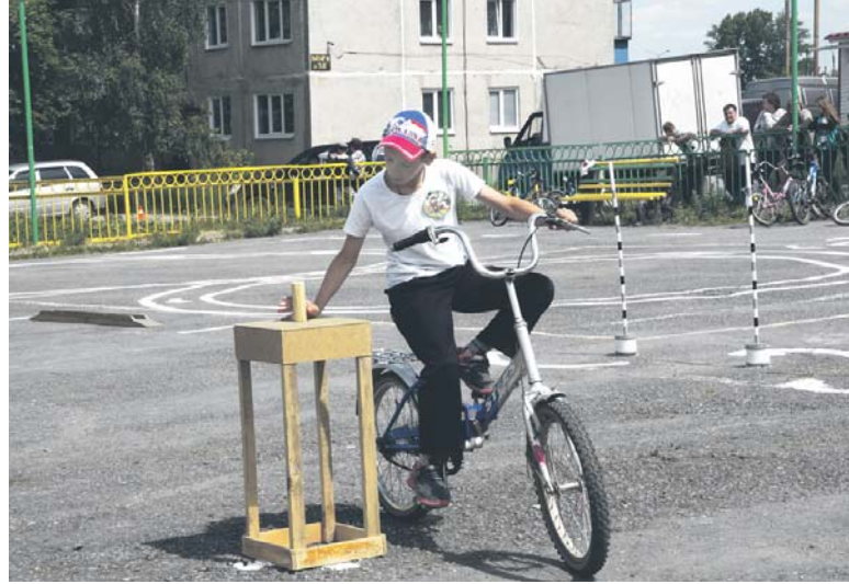
Водить велосипед — непростое мастерство

Много аварий случается на дорогах. А всё из-за чего? Из-за несоблюдения правил дорожного движения. Ребёнка необходимо в детстве научить, как правильно переходить дорогу, перевозить велосипед, объяснить все цвета светофора. 10 июня в Центре детского творчества наши инспекторы дорожного движения и медработники на городских соревнованиях юных велосипедистов «Безопасное колесо» проверили знание ПДД и способность оказать первую медицинскую помощь. Участвовали команды школ №№ 1, 5, 7, 23 и школы с. Минки.