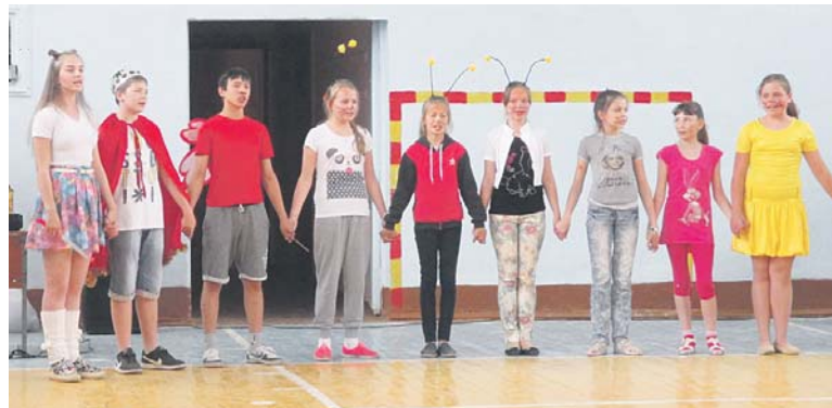
Вожатская клятва — священная клятва

— Мне нравится работать вожатым. Дети меня слушаются, мы с ними очень сдружились.