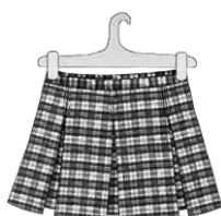
ЮБКА от 800 руб.