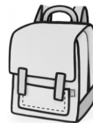
ПОРТФЕЛЬ от 800 руб.