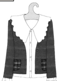
БЛУЗКА и ЖАКЕТ от 1300 руб.