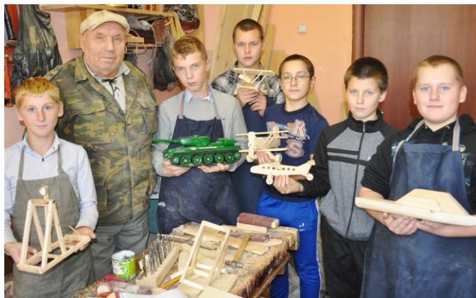
Вот что мы умеем!

Сначала я научился делать доску для кухни: разметил детали – нарисовали карандашом, затем ножовкой выпилил