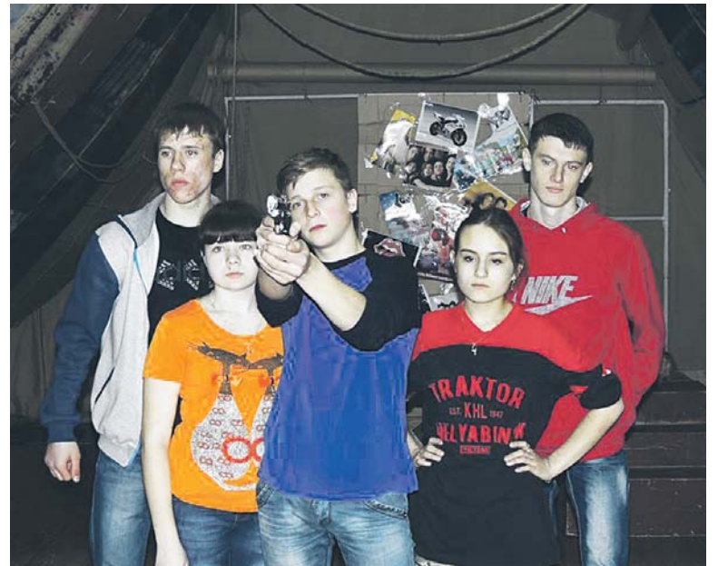
В апреле студия Молодёжного театра пригласит вас на «Чердак». Следите за афишей!