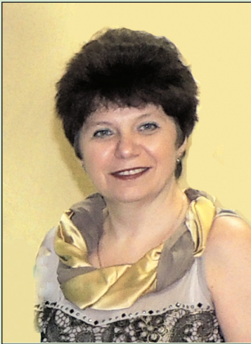
Точка зрения главного редактора