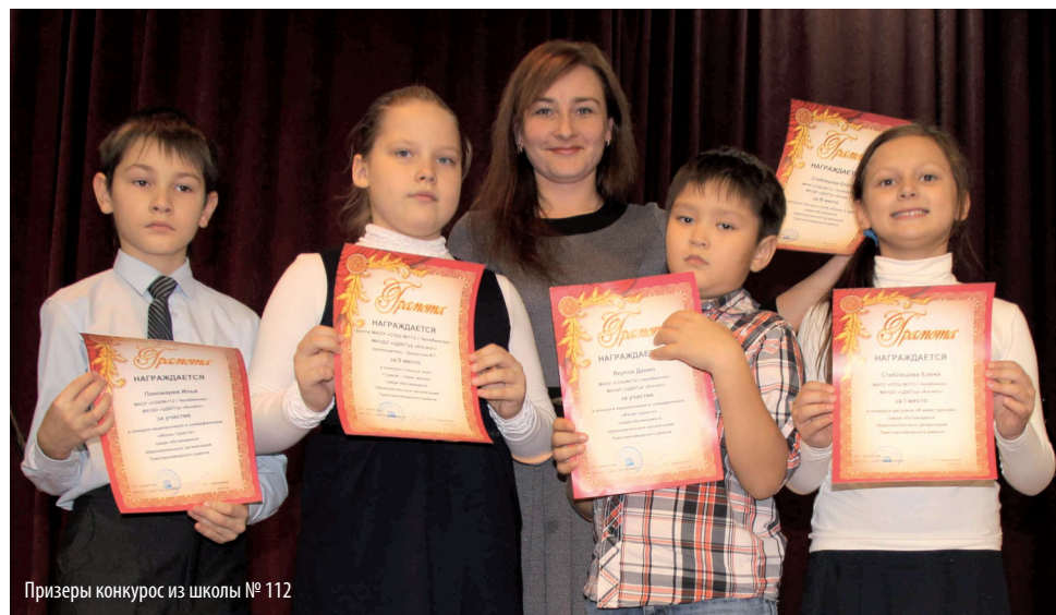
Призеры конкурсов из школы № 112

И, конечно же, все победители и призёры побывали на сцене и были награждены грамотами и призами! Лучшие материалы ребят опубликованы ниже.