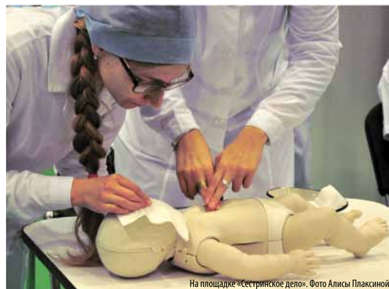
На площадке «Сестринское дело».