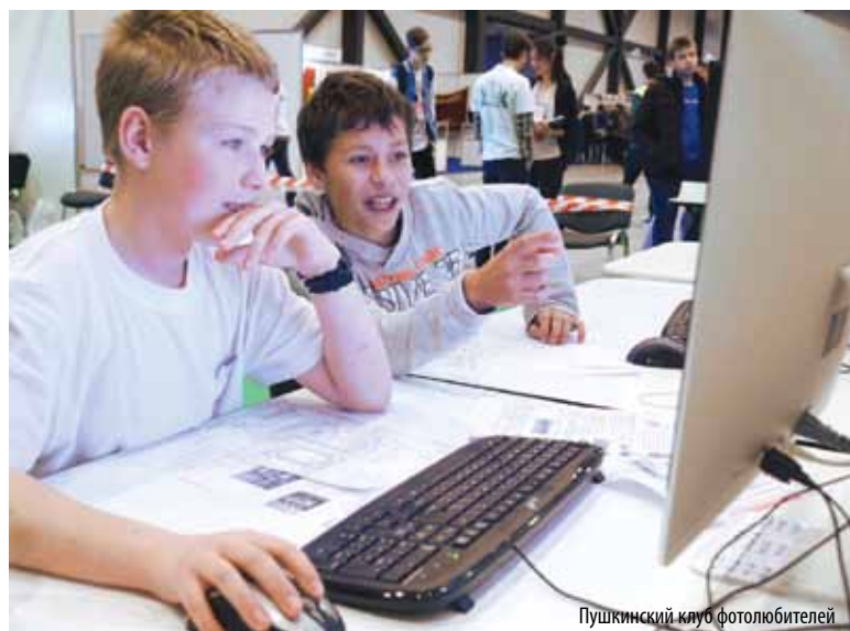
Пушкинский клуб фотолюбителей