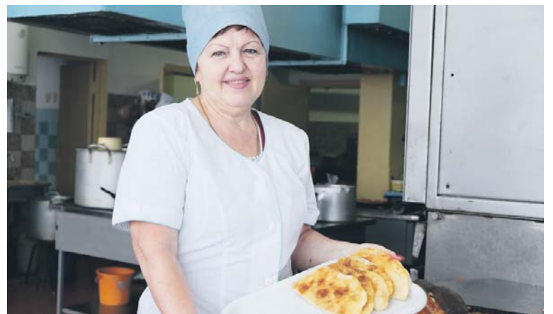
У красивых поваров и обеды вкусные

Филе рыбы пангасиус посыпать солью, перцем и полить соком лимона. Раскатать тесто, выложить на него порезанную на кусочки рыбу и сделать пирог тоже в форме рыбки. Затем поставить его в духовку, разогретую до 180—200 градусов. Запекать 45 минут. Итак, я узнала, почему нас не балуют пельменями, какое блюдо самое вкусное для школьников, и, конечно, узнала новый проверенный рецепт. Приятного всем аппетита! Дарья МОШКОВА.