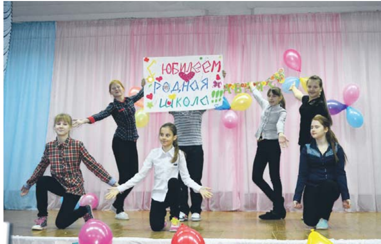
Учащиеся школы своими силами подготовили концерт