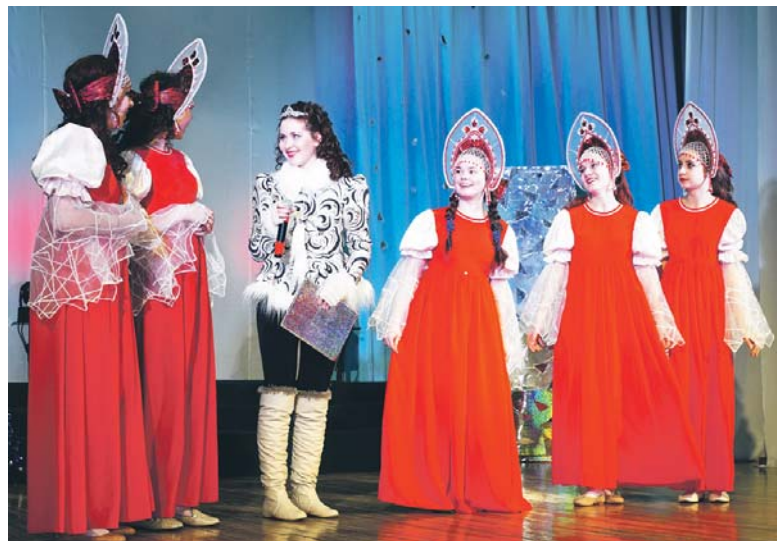
Конкурсу «Снегурочка» предшествует очень большая подготовка. Не удивительно, что болельщики сильно переживают именно за свою конкурсантку

— Не считаю конкурс борьбой, я участвовала для участия. Мне не был важен результат. Для ме-