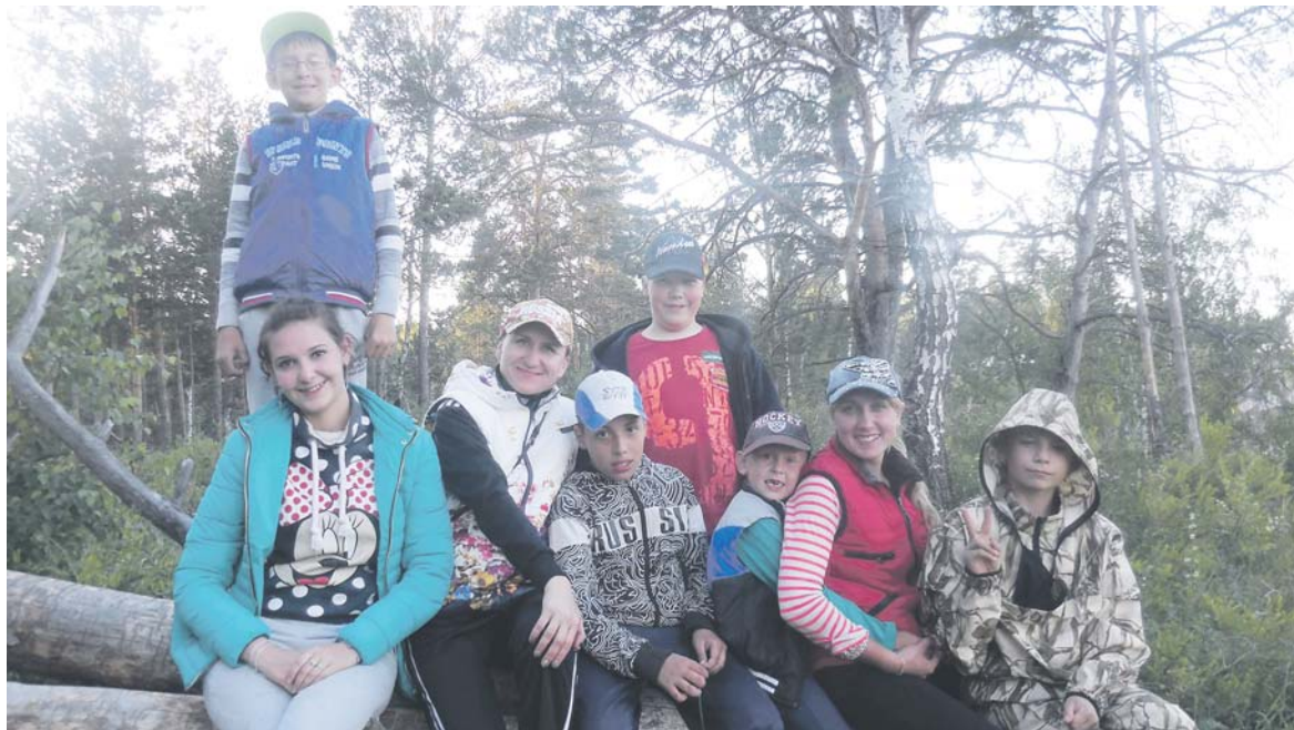
Попутчики первого моего сплава по реке