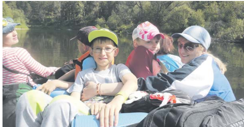
Мы в ожидании приключений