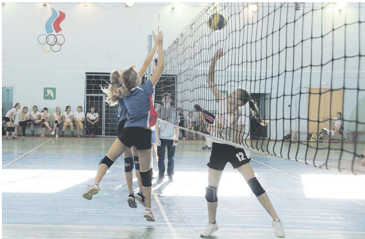
Один из многочисленных острых моментов