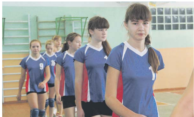
На приветствии команда школы № 1