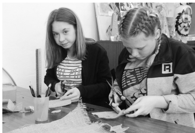
Изготовление модулей из мешковины для панно.

На занятиях я рассказываю о создании своими руками предметов быта декоративного характера. Мы касаемся разных тем: от назначения изделия, до технологии изготовления. На каждом этапе дети включаются в работу от проектирования до создания изделия. На этапе обработки материалов часто дети второго года обучения помогают детям первого года обучения. Это очень важный момент для тех и других. Ведь очень важно почувствовать себя опытным в данной сфере, а также дать совет. Очень хорошо это получается у Татьяны Никулиной и Полины Лычаговой . По завершению создания картин или