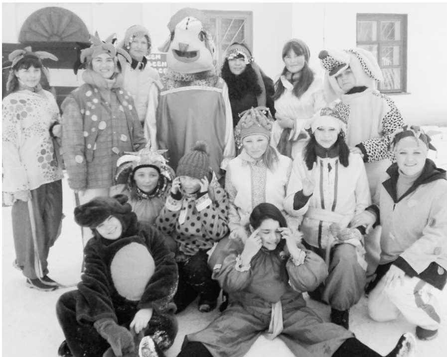
Общесельский массовый праздник «Масленица»