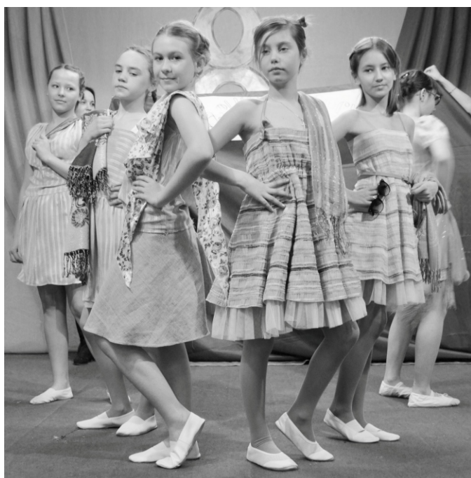
Дефиле «Льняные фантазии», март 2017г.