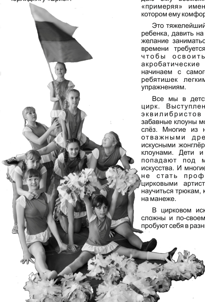
Спортивный коллектив по черлидингу «Бриз»

С удовольствием приглашаю к нам энергичных и смелых мальчишек и девчонок, у нас они откроют для себя безграничные физические возможности.