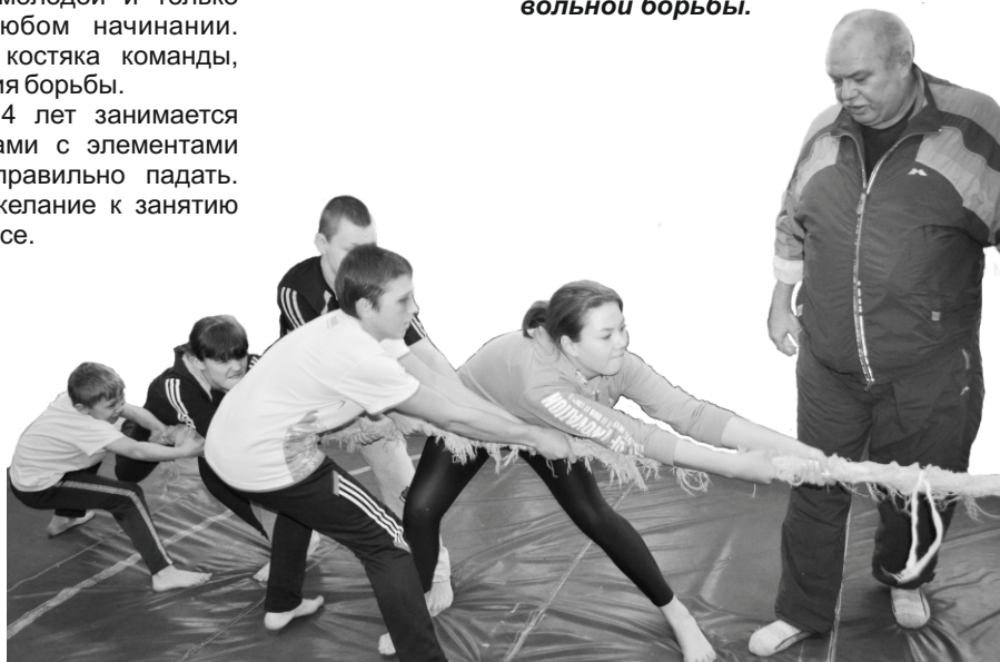
Вместе мы - КОМАНДА!

Приглашаем всех желающих заниматься в секцию вольной борьбы.