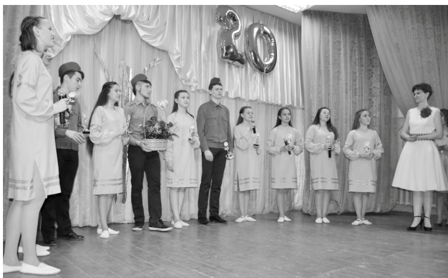
Поздравление от выпускников с Юбилеем творческой деятельности.

Я вижу, как меняются мои ученики. Они уже полюбили танец, он занимает большое место в их жизни. Такая у меня работа, идти вместе с учениками в мир искусства, где по ту сторону «Радуги» нас ожидает не только красота тела, но и красота души и духа.