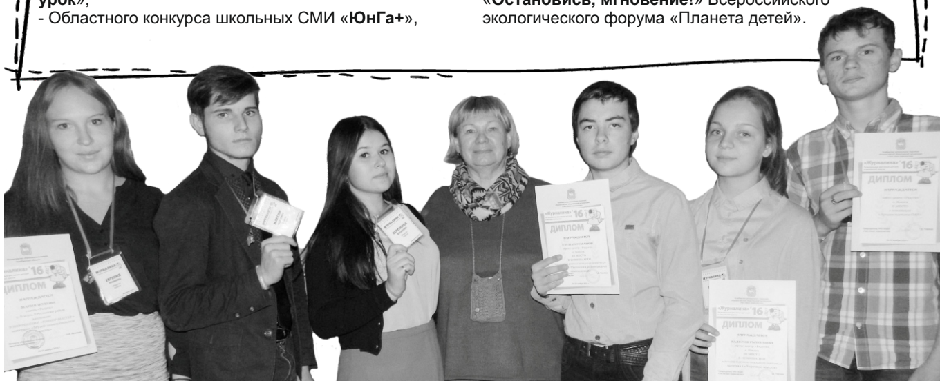
Делегация пресс-центра на профильном областном фестивале детско-юношеской прессы «Журналина».