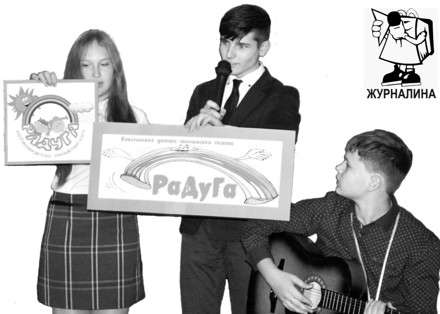
Творческая презентация Коелгинской детско-юношеской газеты «Радуга».

Пресс-центр «Радуга» - одно из самых сильных и динамично развивающихся объединений детей и подростков. Ещё ни один год юнкоры будут радовать читателей, создавая общее информационное пространство детей и молодежи Еткульского района.