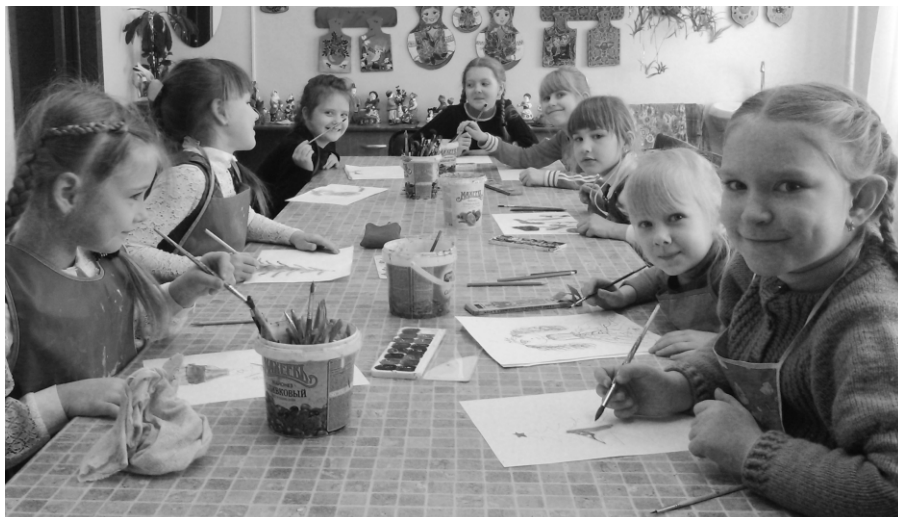
2017г. Группа 2-ого года обучения. Разработка эскиза по мотивам гжельской росписи.