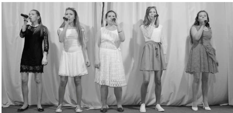
Выступление творческой группы

Музыка - средство самореализации и самовыражения. Она позволяет выйти за пределы мира детства и построить собственный мир. Глядя на маленьких артистов, забываешь об их возрасте, настолько они убедительны, уверены в своём творчестве, и я учусь вместе с ребятами понимать музыку по-новому, глазами и сердцем ребенка. Искренне, без обмана. И мне кажется, что дети многое дают мне в ответ. К сожалению, не дано взрослому человеку верить, любить и понимать так искренне, как ребенку. Ребенок - это чистый лист, самый честный слушатель, самый требовательный и бескомпромиссный критик, а мы, взрослые педагоги, формируем личность. И только от нас зависит, каким будет в будущем наш ученик.