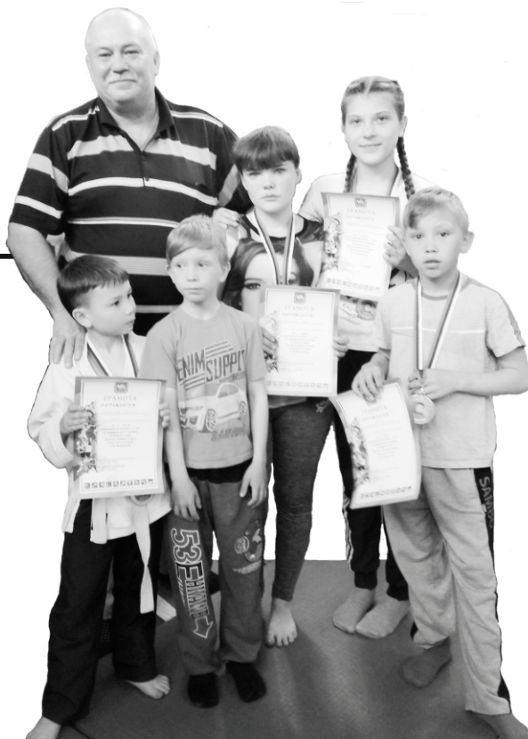
Первые победы юных борцов.

В старшей группе (с 14 лет) также не только мальчики, но и девчонки. Сформировался уже костяк. Видны результаты и желание заниматься