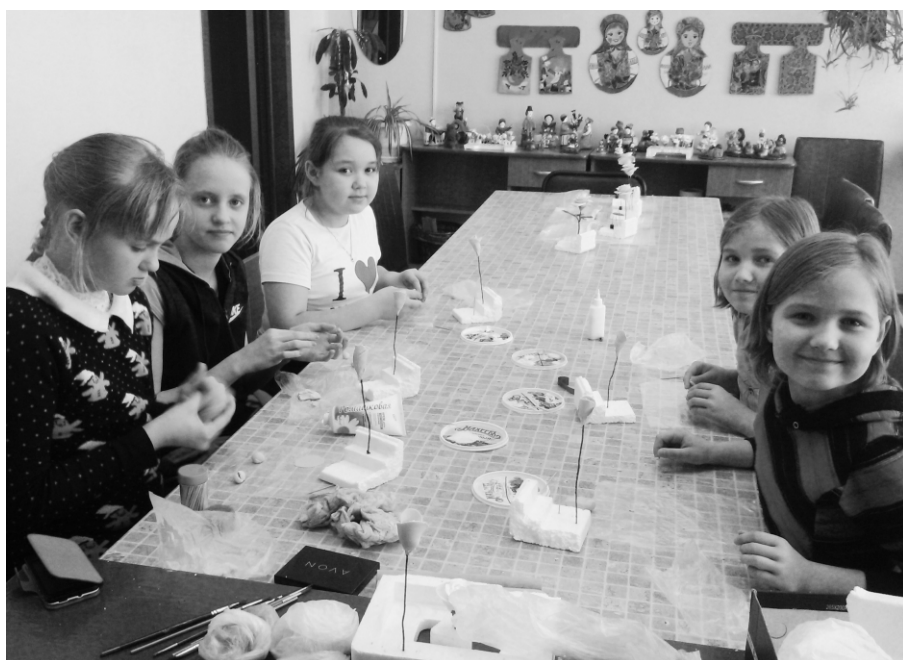
2016г. Группа 3-его года обучения. Лепка розы из холодного фарфора.