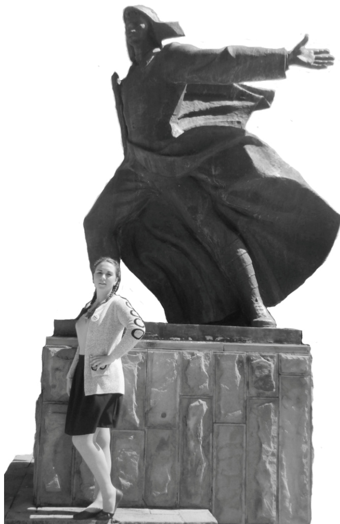
У памятника «Орлёнок» фото обязательно!

прекрасный день мы совершили поездку в Краснодар, где посетили кинотеатр, боулинг и игровые автоматы. Там мы получили огромное количество эмоций, после чего вернулись в лагерь.