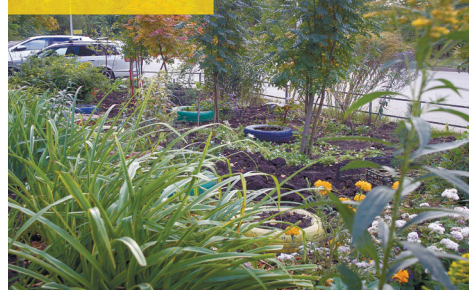
ул. Котина, 3

рассказала, что раньше ей мало-помалу помогали соседи-садоводы, сейчас же высаживает все сама. Летом ЖЭК ей оплатил шланг для воды, за это она благодарна.