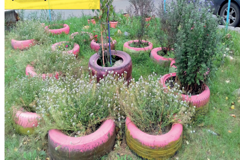
ул. Хохрякова, 22А

из покрышек от автомобиля, разукрашенные в зеленый, желтый и красные цвета. А возле подъезда стоит небольшая экспозиция, «фишкой» которой являются множество игрушек, сидящих на самодельных небольших скамейках. Также к березе неподалеку привязаны белый медведь, тигр: видимо, чтобы не сбежали. И огорожено это все сетчатым забором, на котором висят небольшие фигурки животных.