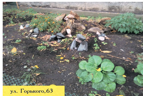
ул. Горького, 63

На улице Горького, 63, возле одного из подъездов высадили маленькую клумбу. На ней росло много пестрых цветов, но ближе к осени стали выделяться желто-оранжевые бархатцы. Они яркими пятнами привлекают к себе внимание.