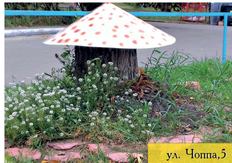
ул. Чоппа, 5

Следующий двор, на который я обратила внимание, находится на ул. Чоппа, 5. Прямо на игровой площадке не-