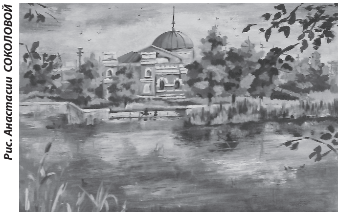
Рис. Анастасии СОКОЛОВОЙ