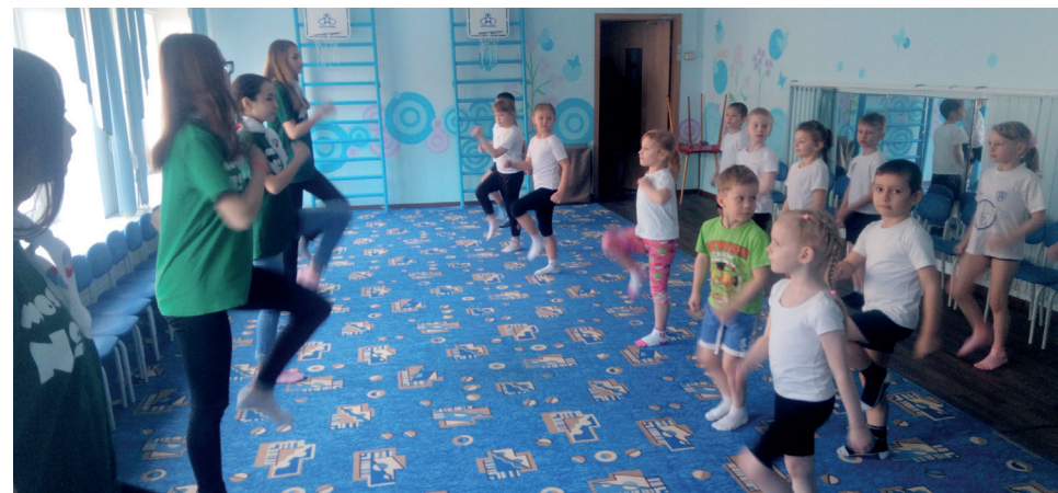
В рамках акции «100 Добрых Дел», ученики школы 107 провели ряд зарядок в нашем районе

Кроме всего прочего, ученики провели настоящий урок ПДД в одном из