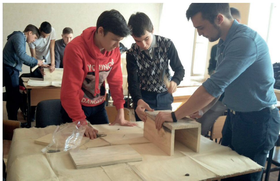
Ученики школы 107 вместе со студентами ЮУрГУ делали скворечники