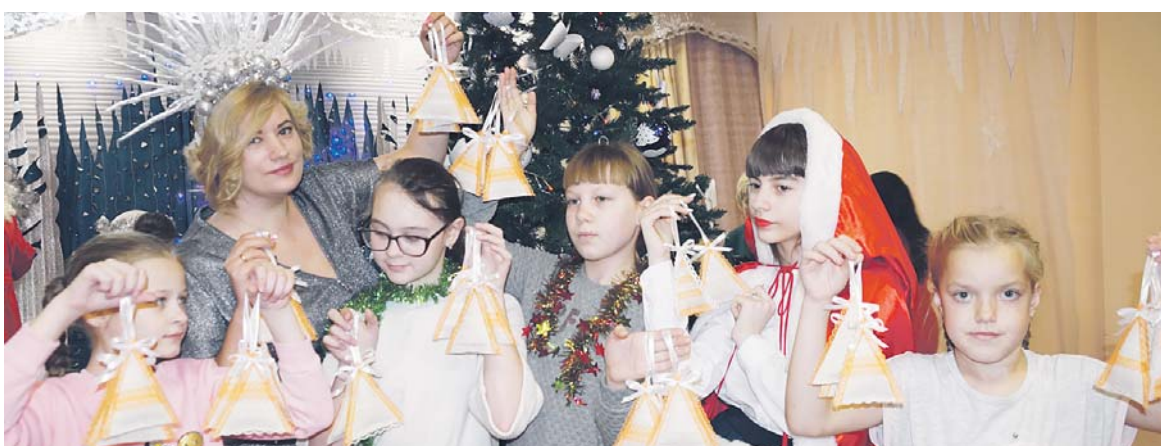
Третий год подряд творческое объединение «Город мастеров» готовит подарки для ребятшек

Яна КУЗНЕЦОВА.