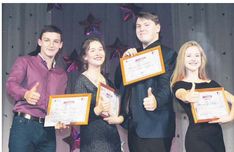
Ребята, которым всё в жизни важно и интересно