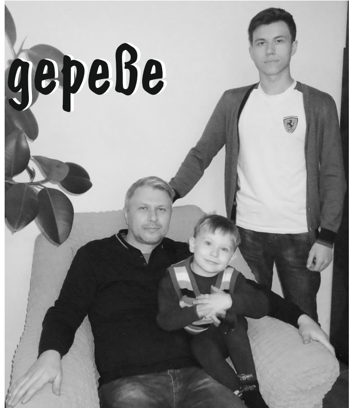
На фото: Я с отцом и младшим братиком.

История моей родни большая. Нас насчитывается более 350 человек и у каждого своя жизнь, своя судьба. Все родственники по бабушке моего отца до революции – крестьяне и охотники. В советское время появилось много