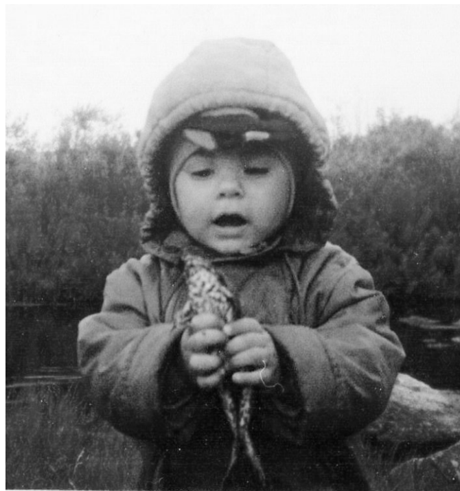
На фото мне примерно три года. Я, возможно, впервые взял в руки лягушку, исследую её и не хочу отпускать...

Далее по списку идут порезанные вены. Не подумайте, что это была попытка суицида в 6 лет, просто несчастный случай. Мы с друзьями играли в «баши» на деревянных горках, где было много стёкол. И вышло так, что я запнулся об камень и полетел вперед руками, напоровшись на стекло. Кровь хлестала ручьем. Мне было