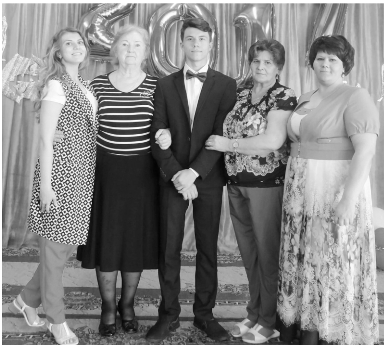
На фото: Я с бабушками, мамой и сестрой.