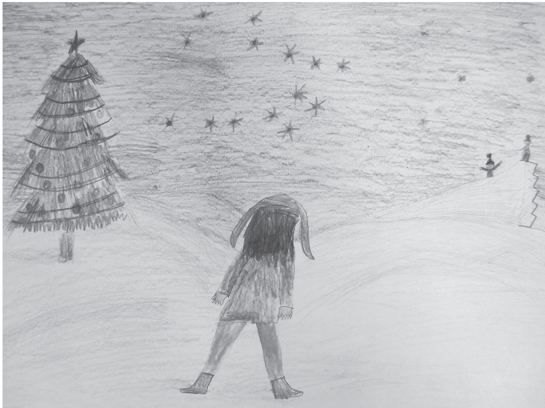
Арина Захарова, рисунок автора

Ж ил-был на далёком севере, среди льдов и снегов, маленький белый медвежонок. Рос он не по дням, а по часам, и очень любил свою маму.