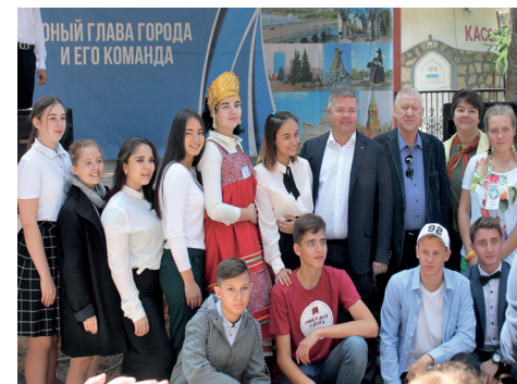
Анастасия Щербатова

первый взгляд незначительную инициативу. Но если команда услышит голос каждого, то из малого дела вырастет большое». ●