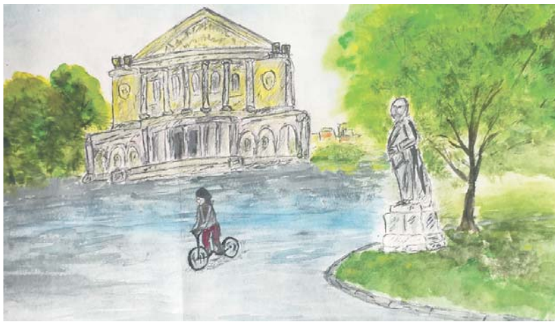
Арсений Лазарев, школа № 5