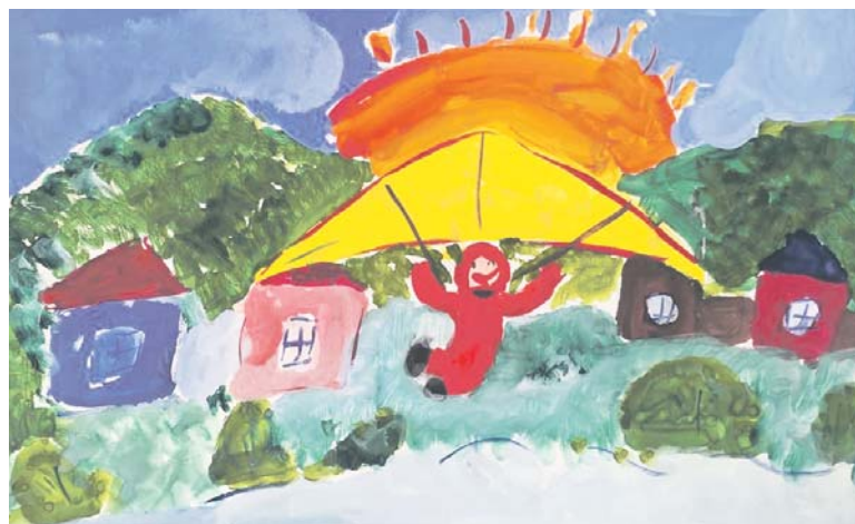
Оксана Сиротина, детский сад № 13