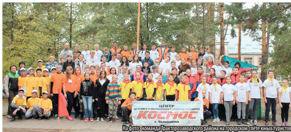
На фото: команда Тракторозаводского района на городском слёте юных туристов

Комитетом по делам образования города Челябинска при непосредственном участии МБУДО «Станция юных туристов г. Челябинска» проводился смотр-конкурс на лучшую организацию туристско-крае-