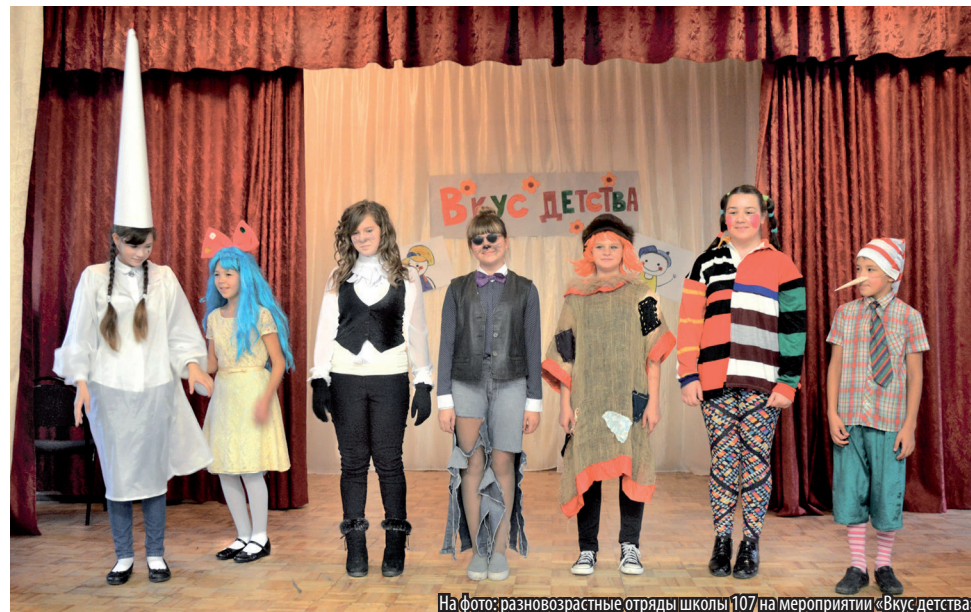
На фото: разновозрастные отряды школы № 107 на мероприятии «Вкус детства»

Среди разнообразных по форме и содержанию дел многие стали традиционными: однодневный выездной сбор на озере Смолино, Новогодняя ночь, Ярмарка, трехдневный сбор на озере Акакуль. ●