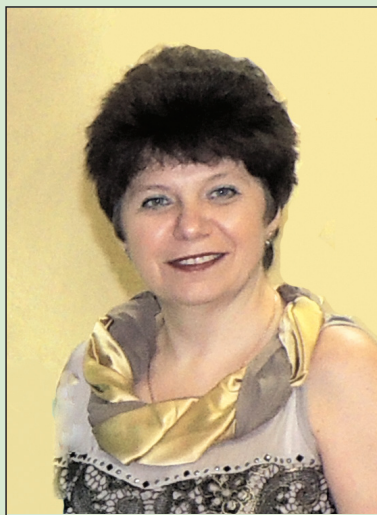
Точка зрения главного редактора