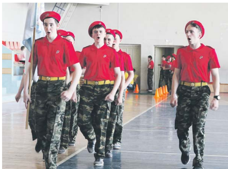
Смотр строя и песни проходит команда УКИТТ