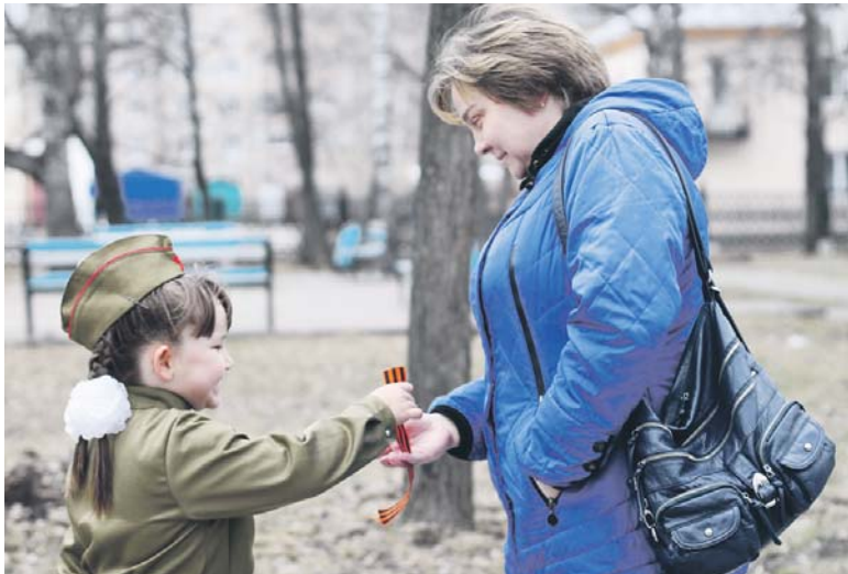
Устькатывцы, не скрывая улыбок, принимают ленточки от малышей

2 мая на площади Городского Дворца культуры прошла акция «Георгиевская ленточка—2018». Под организацией Анастасии Комковой-Крыловой дети раздавали Георгиевские ленточки и поздравляли прохожих с наступающим праздником.