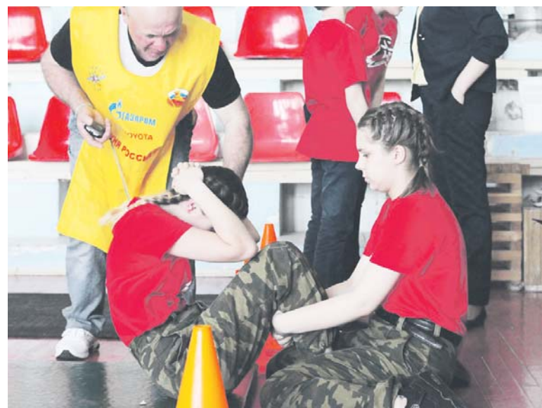
Взаимовыручка и физическая подготовка — отличительные черты юнармейцев

Ольга КОРОБЧЕНКО, куратор движения «Юнармия».