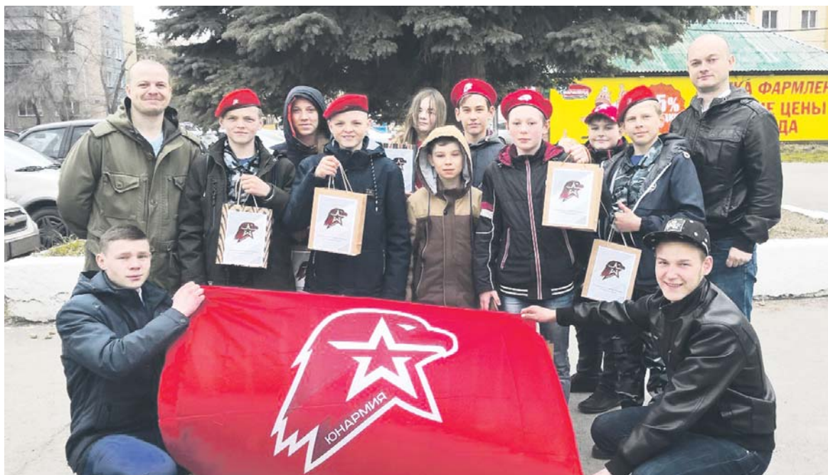
Делегация нашего округа на Втором региональном слёте ВДЮВПОД «Юнармия» в Челябинске

Юнармия — это всероссийское военно-патриотическое общественное движение (ВВПОД) в России, созданное в 2016 году. Его цель — патриотическое воспитание нового поколения российских граждан. Год назад и в нашем городе сформировались первые отряды.