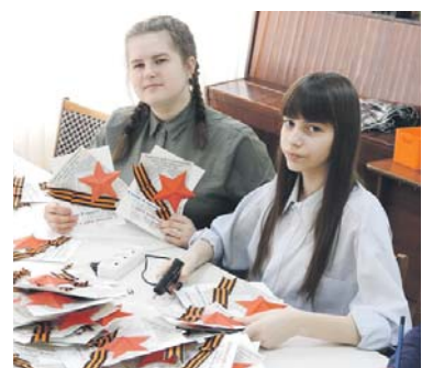
117 открыток изготовили воспитанники «Города мастеров»

Р. С. Воспитанники творческого объединения «Города мас-