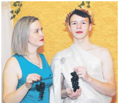
Фото на память с самим Аполлоном

Мария ФИЛИМОНОВА.