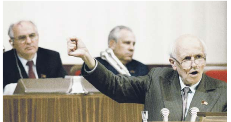
Андрей Сахаров — человек, которым я восхищаюсь

До сих пор он почитаем во всём мире, это легко объясняется множеством заслуг в миротворчестве и физике. Возможно, благодаря этому человеку мы до сих пор живём в спокойное время. Сахаров восхищает непоко-