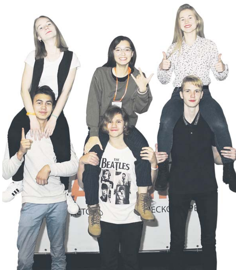
Ребята, с которыми мы встречаемся на «Журналине» уже 3-й год, — мои любимые «старички»

— Принимаю участие в данном фестивале уже третий год подряд. И каждый раз эти дни пролетают безумно быстро. Одним словом, будто, ничего и не было. Хотя на самом деле проделана колоссальная работа и со стороны организаторов, и со стороны участников. Благодаря «Журналине», я побывала в разных местах нашей области, обрела новых друзей, побывала на разных мастер-классах и, конечно, не выпалась. Некогда спать. Очень приятно видеть старых