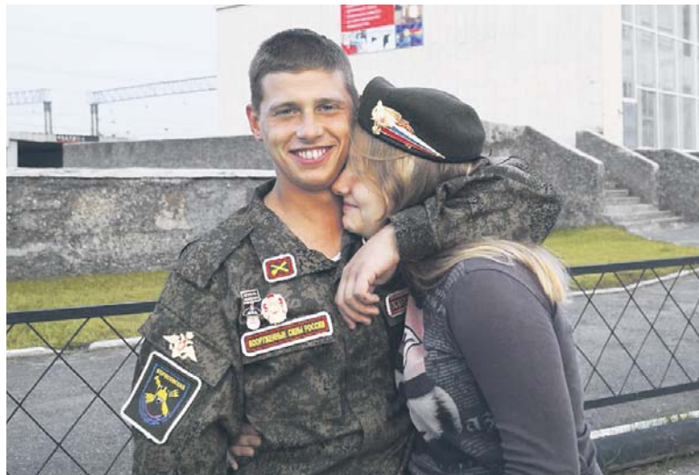
Мой брат — больше, чем семья

На мой вопрос о деньгах у нас разгорелась настоящая дискуссия. В итоге я тоже стала думать, что деньги, конечно, — очень важная часть жизни, но не самая-самая. За деньги не ку-