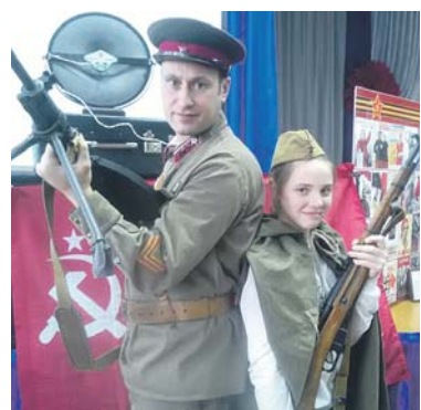
Я ощутила всю тяжесть войны, когда на меня надели форму и дали в руки тяжёлое оружие