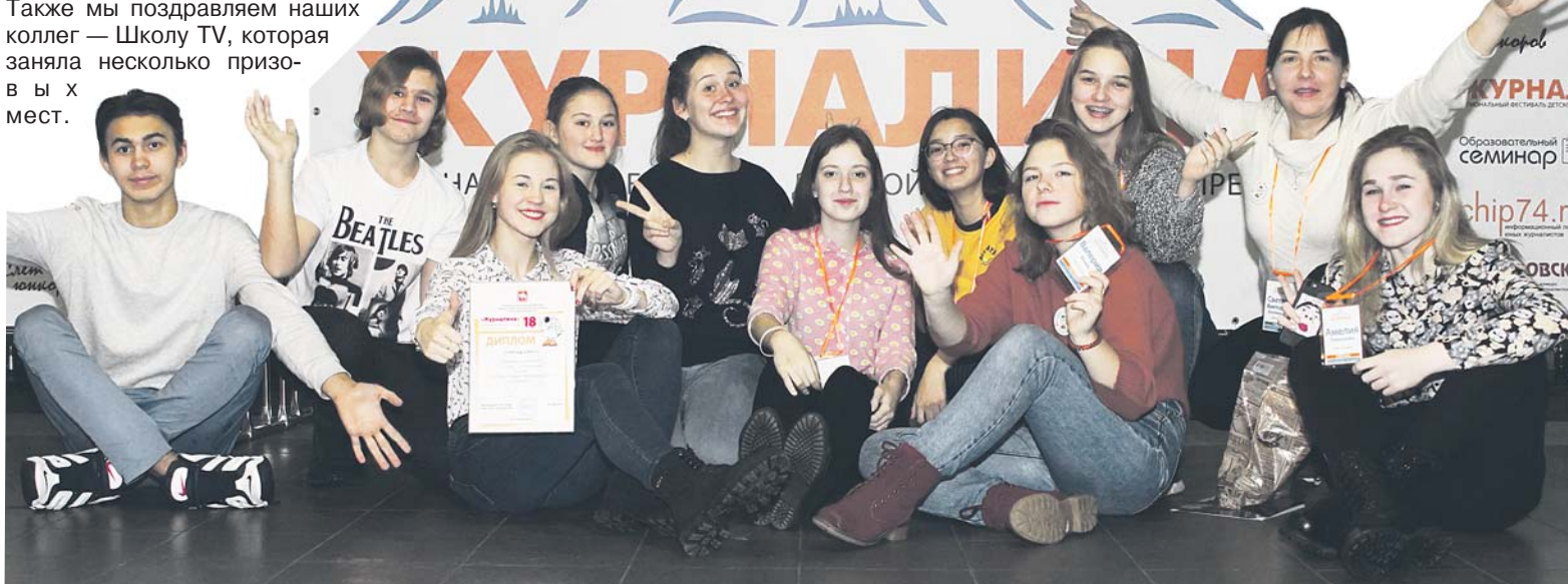
Редакции газеты «БУМ» и Школы TV на фестивале. наших мальчишек взрослые коллеги отметили, как специалистов, готовых вести свои мастер-классы для телевизионщиков