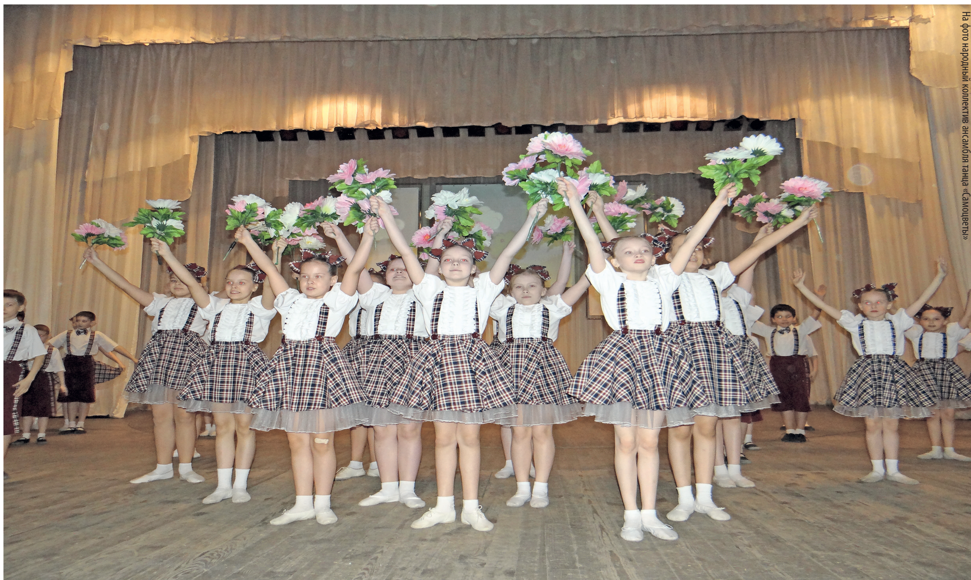
На фото народный коллектив ансамбля танца «Самодуэль»

Газета школьников Тракторозаводского района города Челябинска издается с марта 2007 года