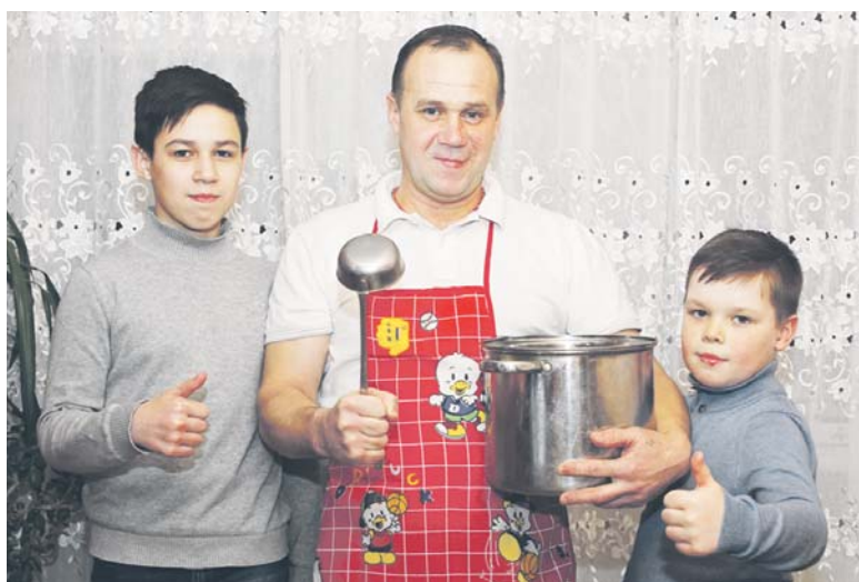
Самый вкусный борщ — у папы!

Екатерина АЛЕКСЕЕНКО.