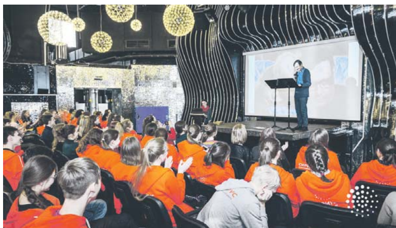
Открытие литературной смены. Актовый зал