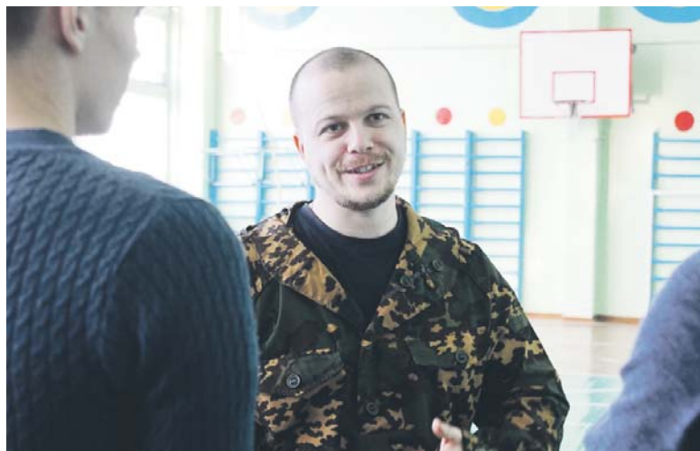
Иван Николаевич объясняет ребятам план урока

Амелия ТИМАШЕВА.