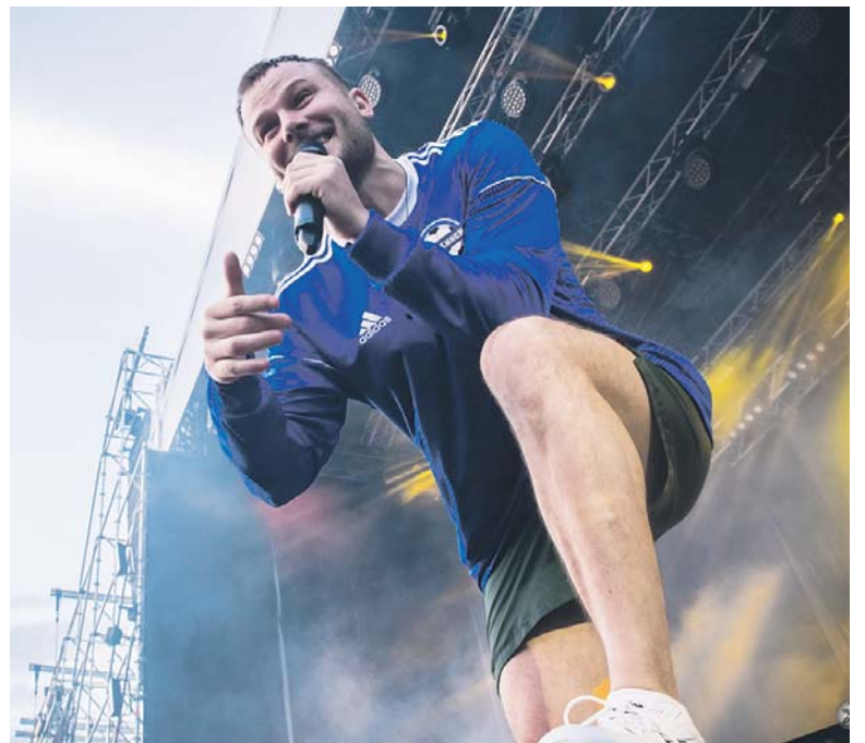
«Лучше спроси себя, зачем тебе ноги» — Посетить кучу стран, взяв с собой зелёный чемодан»