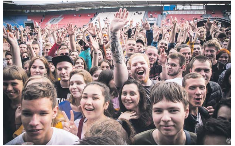
Более 40 автобусов с фанатами едут за кумиром по стране из города в город

Амелия ТИМАШЕВА. Группа в «ВК» — ALICEPanfilovaФОТО.