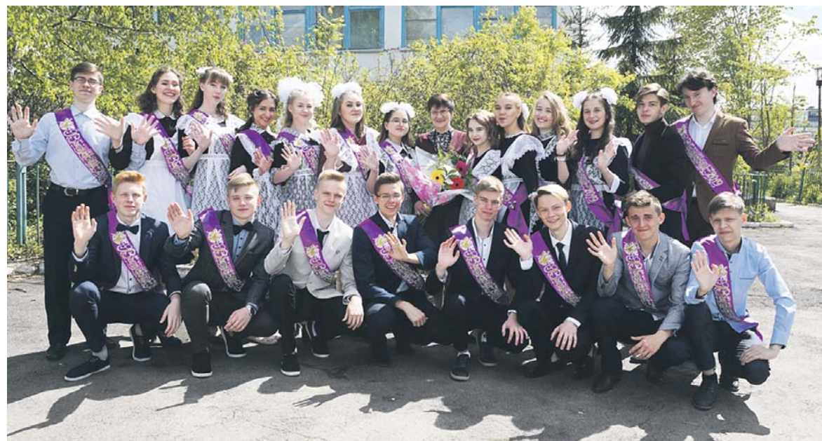
Дружный 11-й класс прощается со школой

Елизавета ПЕТУХОВА.