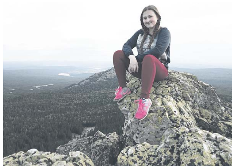
Выше только птицы. И огромное синее небо с облаками