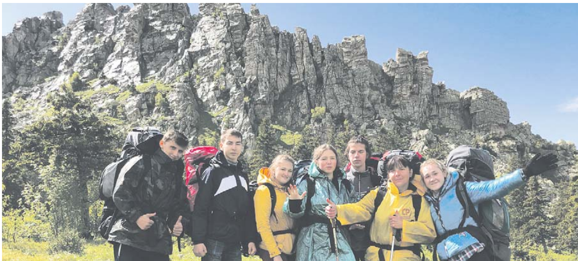
Погода в горах меняется быстро. Пять минут назад был ливень. Гребень Откликной ещё не обсох