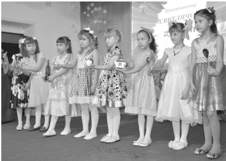
На фото: Учащиеся младшей группы знакомят гостей Детского центра с поделками, изготовленными на занятиях коллектива «Светлячок».