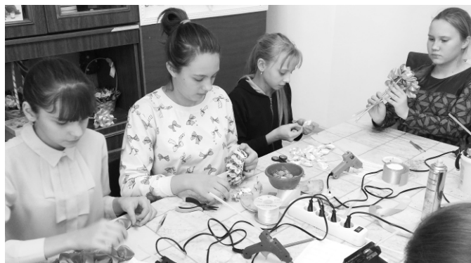
Создаём изделия из атласных лент в технике «Канзашаи»