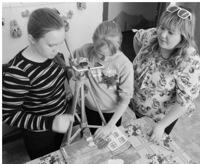
Снимаем мультфильм в технике «Бумажная анимация»