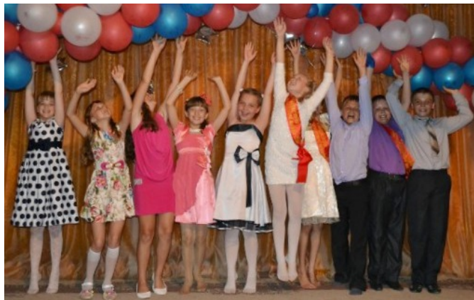
На фото: Мы выпускаемся из начальной школы.

Эта пословица как нельзя лучше описывает период с седьмого вплоть до одиннадцатого класса. Непременно, это введение новых предметов: физика, алгебра и геометрия (о том, что математика может быть совсем не математикой мы даже и не подозревали). Коротко говоря, учиться в это время совсем не хочется, голова забита совсем другими вещами, тогда кажется, что времени еще очень много, но, как оказалось - нет. Сейчас, большинство из нас, девятиклассников, жалеет о том, что в это время не воспринимали учебу серьёзно. Да и вообще, время пролетает незаметно, словно спортивные автомобили на гоночных трассах. Следующий этап - последний рывок перед сдачей экзаменов. Восьмой класс. В этот год, помня себя, мы продумывали до мельчайших деталей свой выпускной вечер, вспоминали какие-то моменты из прошлого и думали о будущем: экзаменах (но не о подготовке к ним), поступлении и т.д. И вот, медленно, но верно, мы встали на финишную прямую.