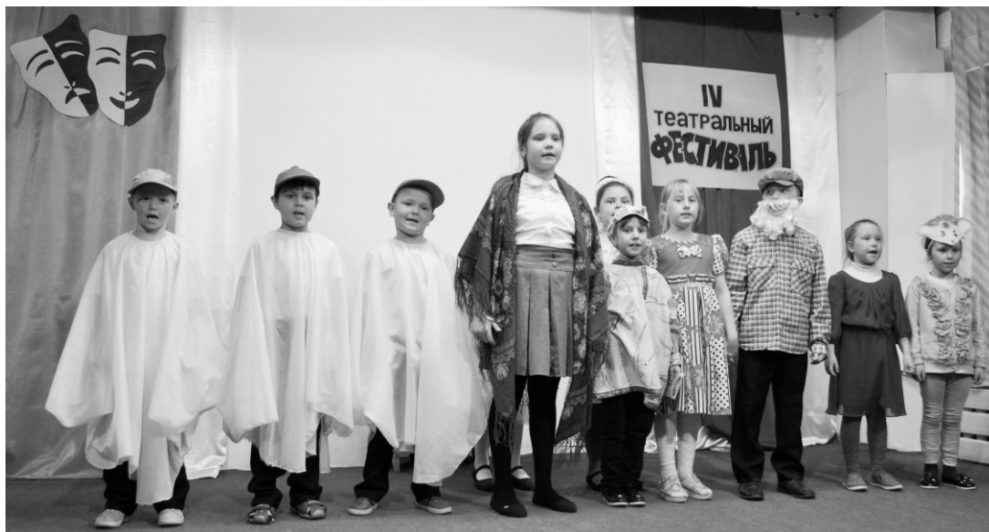
На сцене дипломанты конкурса - юные артисты театрального коллектива «Родник» в спектакле по русской народной сказке «Гуси-лебеди»