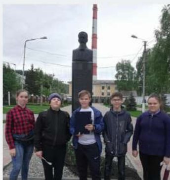
Мастер-класс обзорной экскурсии по городу с 6 «Б» классом