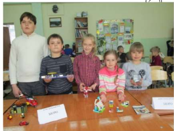
Материал подготовили Курдакова Екатерина и Кузнецова Дарья