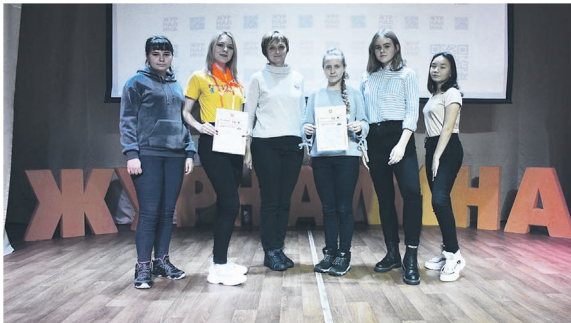
Впечатления, которые подарила Журналина, останутся с нами на весь год

Не менее интересным было одно из самых творческих и сложных соревнований — «Фотокросс». Это состязание фото-