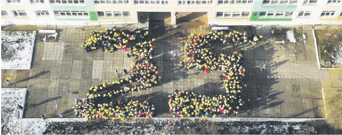
Четверть века учителя и ученики вместе

В ноябре 1994 года школа № 7 впервые распахнула свои двери, а уже в этом году отпраздновала своё двадцатипятилетие.