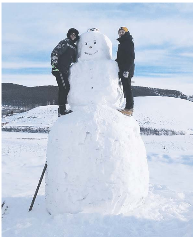
Вы можете посмотреть процесс сотворения снеговика на видео, введя ссылку https://youtu.be/d5i_2bJ9ZUM в браузере.