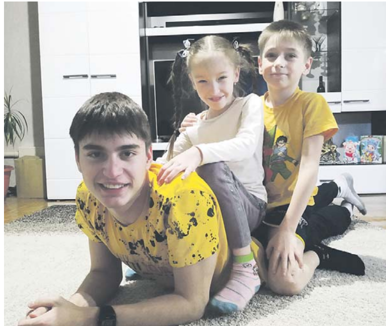
Старший брат — хороший пример для подражания

— Милая, нежная, беззащитная — это про твоих современниц? Или всё это пережиток прошлого?