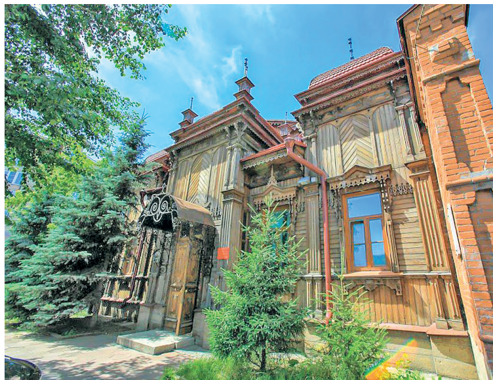
Здание Центра развития туризма на ул. Красноармейской, 100

— В принципе, это большое число, хотя, конечно, хотелось бы, чтобы количество отдыхающих возросло. В этом и состоит наша задача. В нашей области проходит множество событийных мероприятий, которые тоже ежегодно привлекают тысячи туристов в нашу область, это «Ильменский фестиваль»,