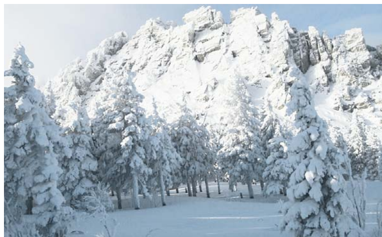
Вид на Откликной гребень