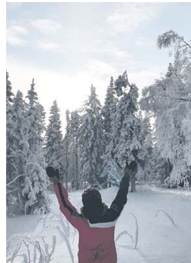
Мы живём в сказке