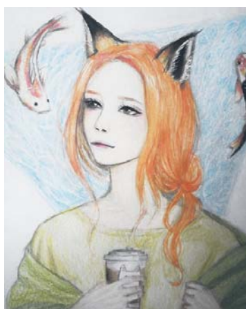
Чулпан Panter. Рисунок Minogi из сообщества «Art Амино».

Амино — весёлое сообщество, где ты выберешь занятие на свой вкус, там же можно создать свою группу. В нём сидят от 1 000 до 100 000 человек! Также вы можете встретить меня в этих сообществах: «Fnaf», «Амино», «Art Амино» и другие. В общем, всё не передашь словами, просто загляните сами в этот уютный уголок счастья.