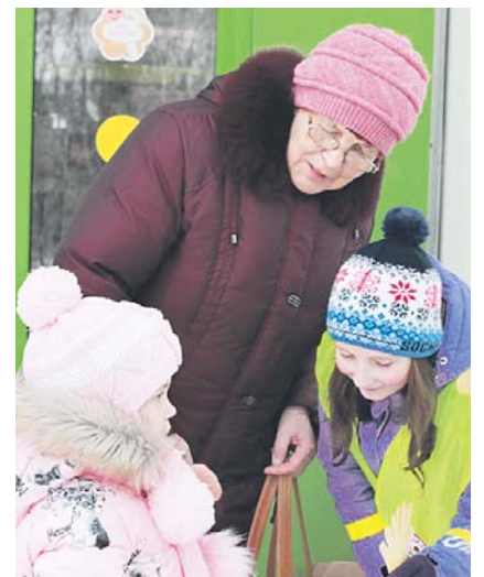
Фликер «Ладوشка» теперь есть у жителей центра