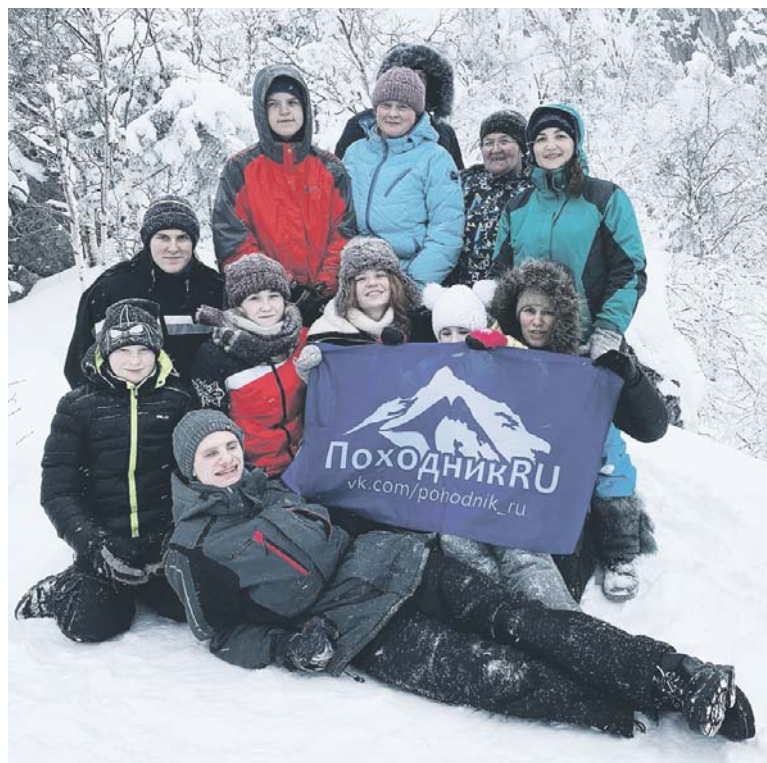
На вершине Двуглавой сопки