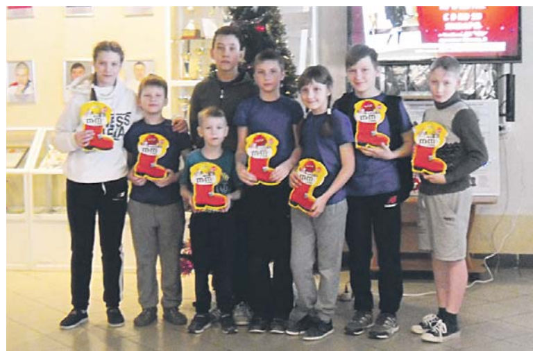
Детская секция настольного тенниса — участники турнира