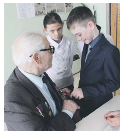
Медали интересны мальчикам