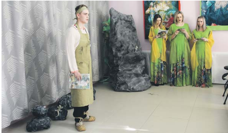
Данила-мастер в гостях у Хозяйки Медной горы