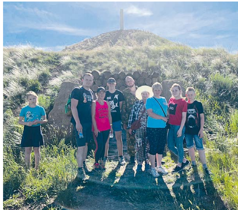
Знакомство с культурой ариев. Погребальный курган

современной цивилизации в водвороте жизни. Одни хотят покинуть пыльный город и слиться с природой, подышать воздухом степи, увидеть её бесконечные ковыли. Другие считают Аркаим местом силы, могучим источником потусторонних явлений, где обитает невидимая сила древ-