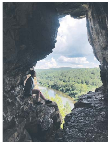
Вид на Юрюзань из пещеры Салавата Юлаева