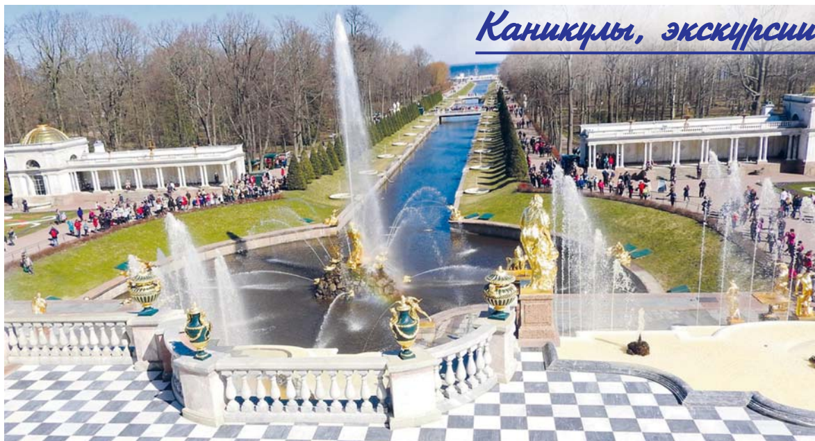
Нижний парк в Петергофе. Морской канал и аллея фонтанов

На следующий день по плану — Екатерининский дворец. Очередь в него огромная. Пока мы ожидали своей очереди, я пообщался с иностранными туристами. Дворец состоит из больших комнат: прихожая,