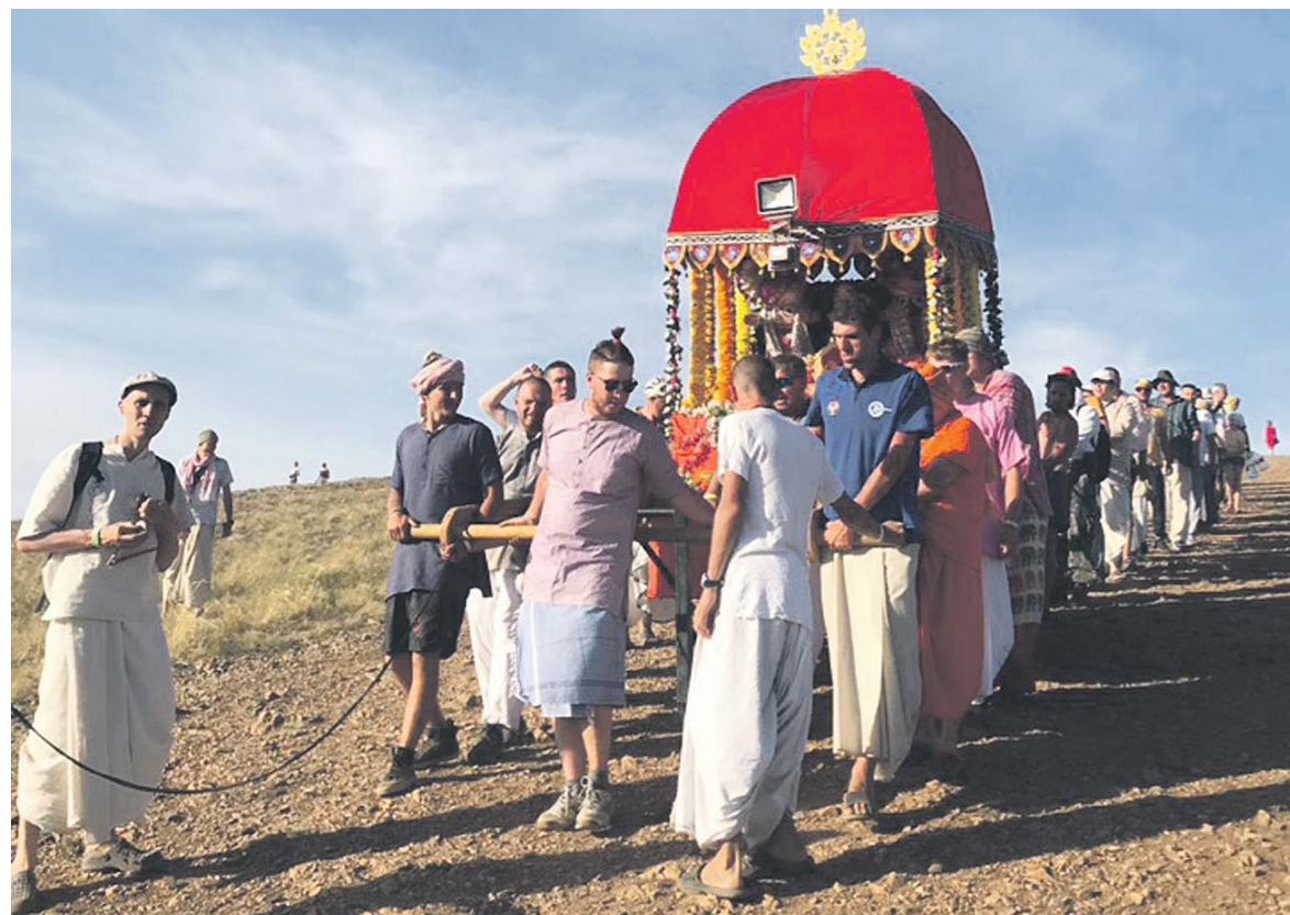
Богов спускают с Шаманки с песнями и танцами

Всё, что вы задумаете, загадаете на священной земле Аркаима, будет наполнено особой мощью, особой энергией для исполнения. Любые практики, медитации, выполненные там, обретают невероятную мощь.