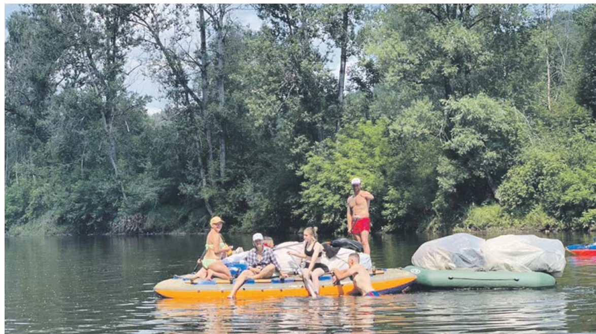
«Походники.ру» отправляются в путешествие

От МЧС пришла смска: «Сильная жара 20–21 июня...». Хмм... Самое время рвануть на сплав хорошей компанией! Собираю в рюкзак всё необходимое. В назначенное время меня забирает автобус. Сажу в предвкушении костра, разговоров, купания в тёплой воде, новых знакомств.