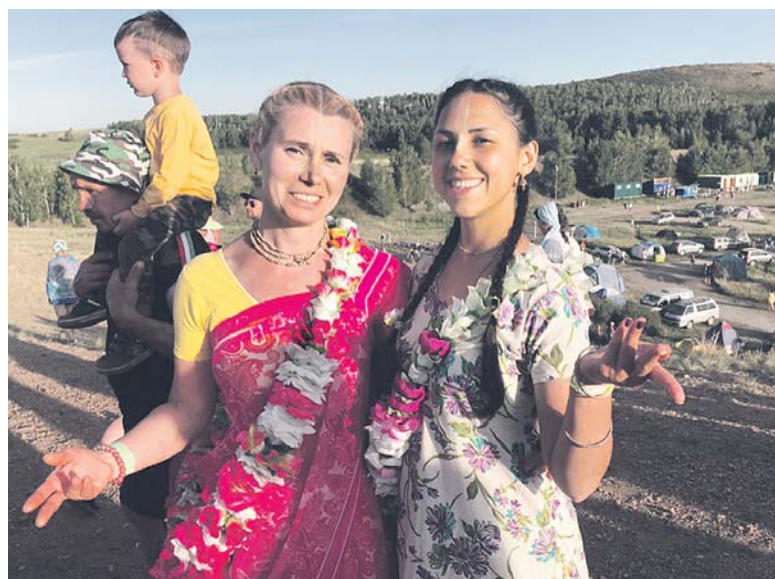
Празднование летнего солнцестояния. Тысячи паломников приехали в Аркаим встретить рассвет

них, ныне почти забытых культур. Каждый решает сам, зачем он едет в заповедник.