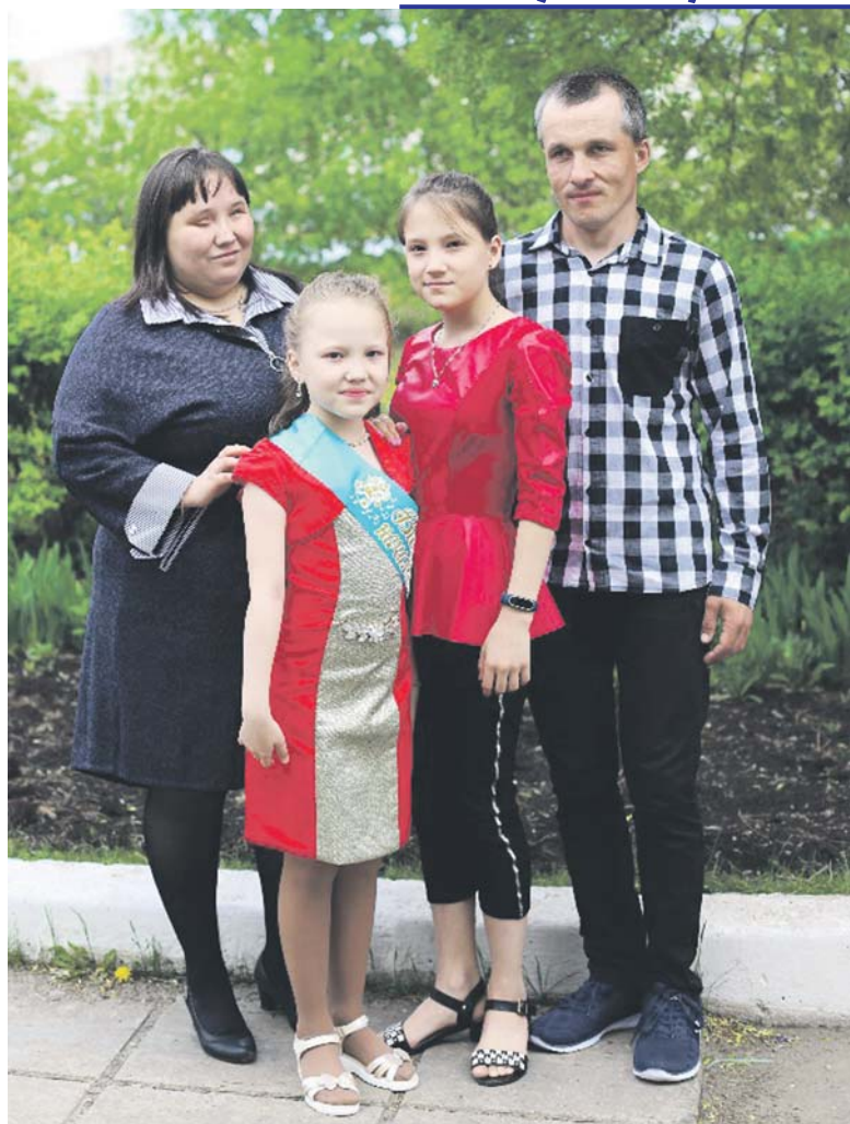
Большую часть жизни родители вместе. У них мы учимся тёплому отношению друг к другу