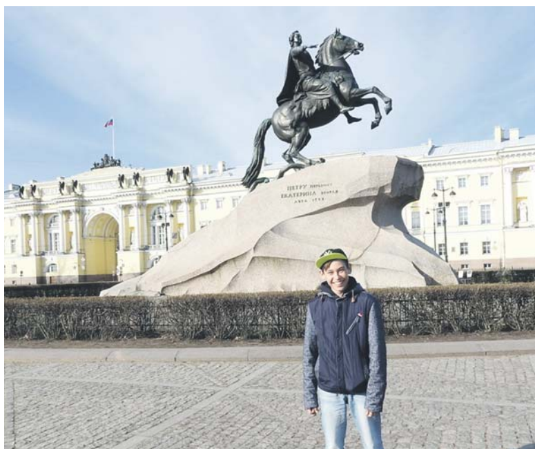
Памятник «Медный всадник на коне» от Екатерины II Петру I