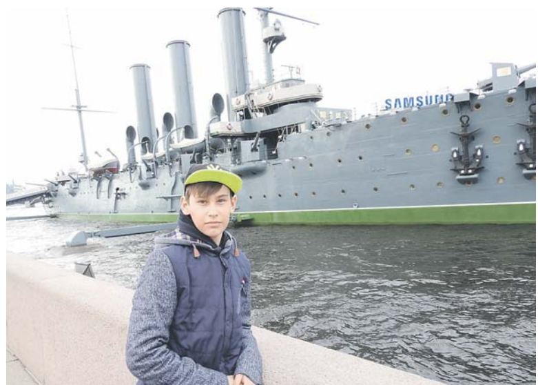
Сегодня крейсер «Аврора» можно посетить, как музей