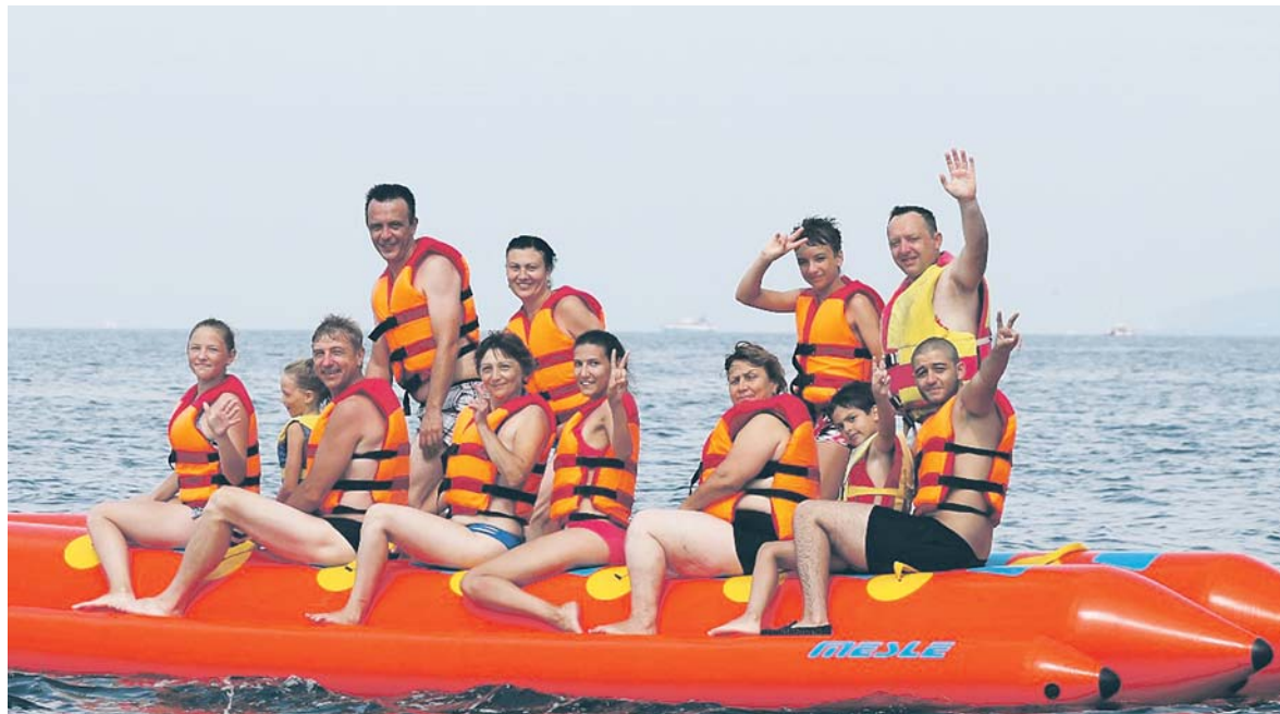
На «банане» — за эмоциями