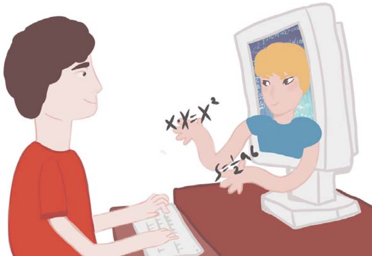
Способны ли сегодня школьники сами добывать знания?

— Думаю, дистанционное обучение может стать альтернативой школьному образованию. Для кого-то это будет лучшим вариантом обучения. У нас в школе есть ученики, которые занимаются спортом и не успева-