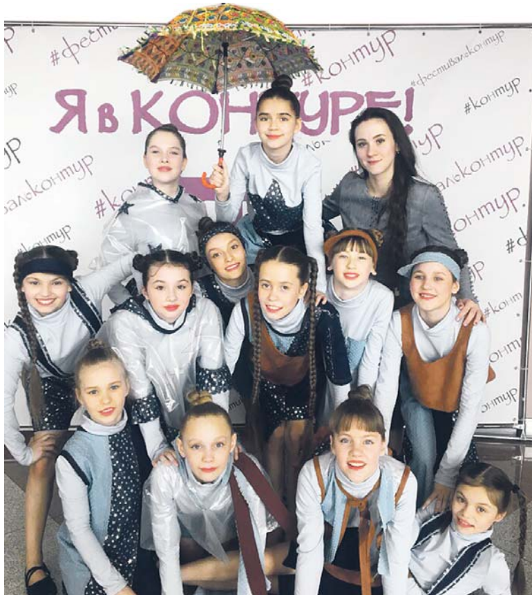
Самая старшая группа большого коллектива

И дети любят свою маму-руководителя, и всегда положительно