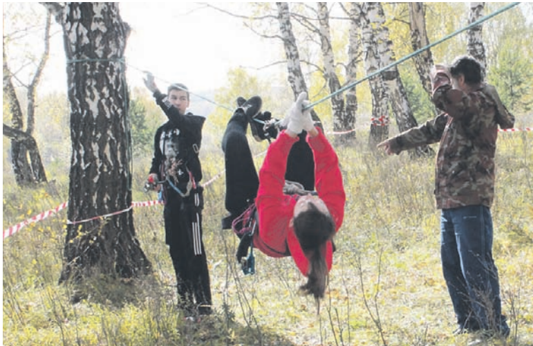
Таюкю переправу без подготовки не преодолеть