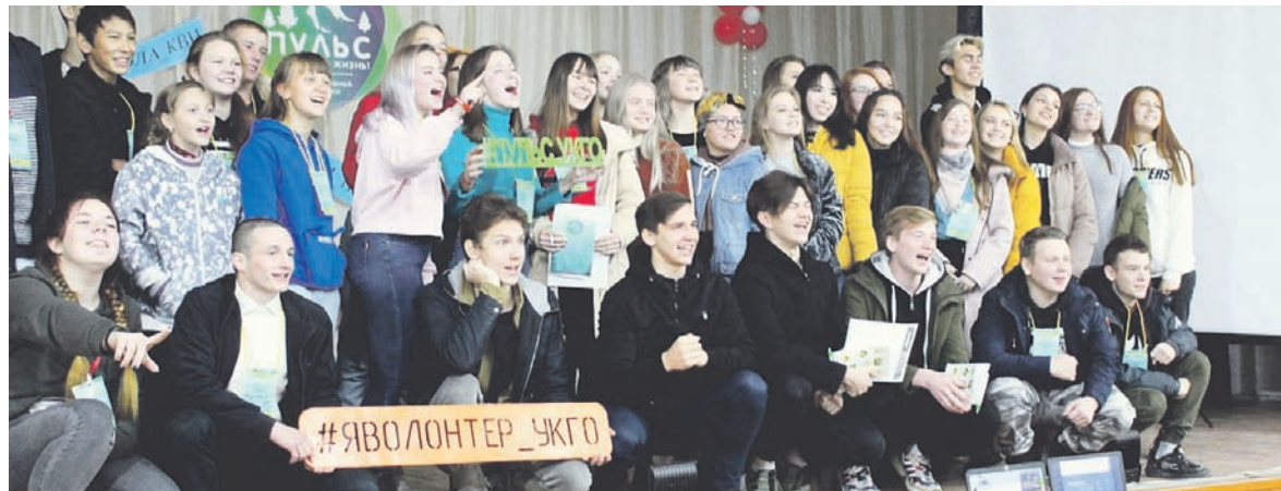
Участники форума «Пульс» и Школы КВН