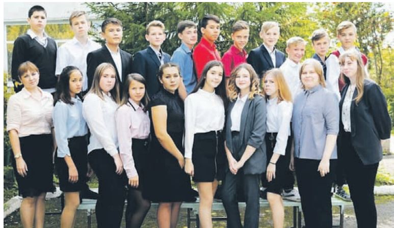
Наталья Александровна всегда рядом со своими учениками