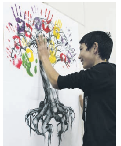
Разрастайся, дерево КВН!

Роман СКРЯБИНСКИЙ. Рисунок Валерии УСОВОЙ.