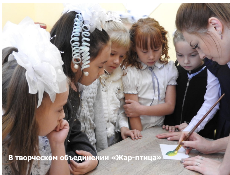
В творческом объединении «Жар-птица»

младшей сестрой собираем сухие листья для поделок в детском саду. Часто гуляем по парку всей семьёй или с подругой и фотографируемся на фоне ярких листьев.