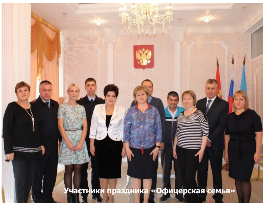
Участники праздника «Офицерская семья»

25 сентября в отделе ЗАГС Пластовского района впервые состоялся праздник «Офицерская семья»