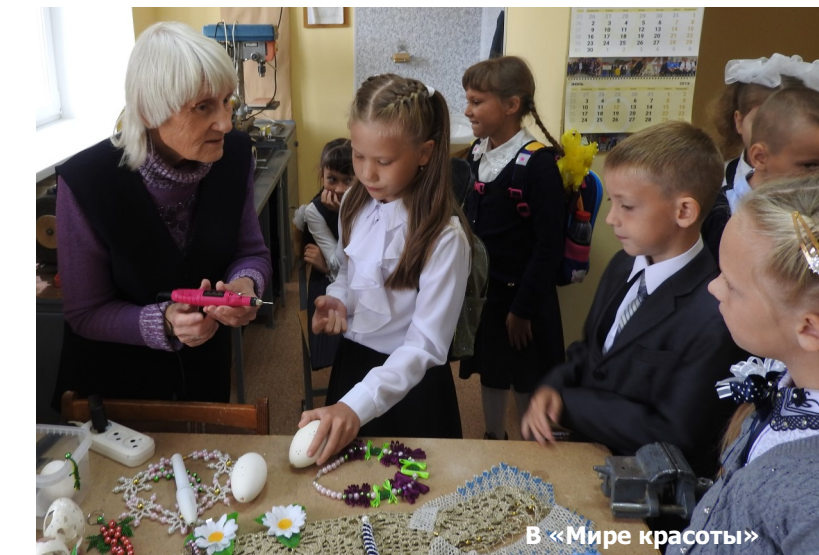
В «Мире красоты»