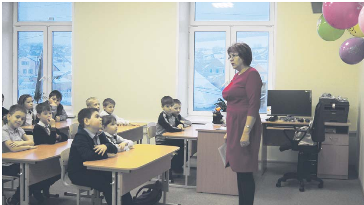
В новой школе с самого утра идут занятия

Вот и прошли новогодние каникулы, время братья за учёбу! Тринадцатого января после длительного ремонта открылась наша школа в посёлке Шубино. Все её ученики очень этому обрадовались! Ещё на подходе к школе нас берут в обзор видеоканалы. Внутри видим новые стены, стоящих дежурных и вахтёра. Прежде такого не было! Везде такой простор! В школе мне понравились комната отдыха, в которой стоят мягкие скамейки, просторная столовая с длинными столами, хорошо оборудованные туалеты. Раздевалка для старших классов теперь устроена отдельно от младших. Но ремонт сделали только в новом здании школы, где учатся младшие классы. В старом — старшеклассники ходят из класса в класс. Обещают, что в апреле этого года начнётся ремонт и в старом здании. Пока он идёт, мы будем учиться с началкой в новом здании. Интересно, а что