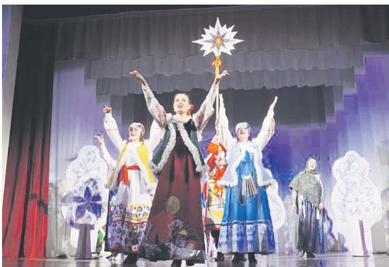
Ребята ещё раз окунулись в сказочную атмосферу Рождества