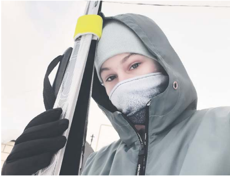
Впереди — новые впечатления и победы

Мы разные, и у каждого из нас разные предпочтения. Это нормально. Каждый из нас хотя бы мимолётно, но задумывался о том, что ему интересно. Одни делают выбор легко, любимое занятие находится быстро, другим не удаётся определиться долгое время.