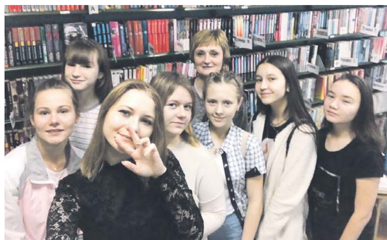
Селфи в библиотеке — интересно и полезно

ручит вас, если библиотека уже закрыта, а печатная будет очень кстати, если в электронном виде нужного издания нет. Но чем же все эти технологии лучше печат-