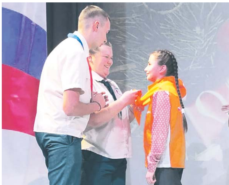
В Усть-Катаве стало на одного Орлёнка больше