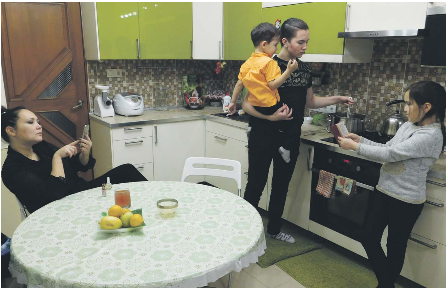
Заменив маму невозможно, а вот на денёк попробовать ей стать даже полезно!