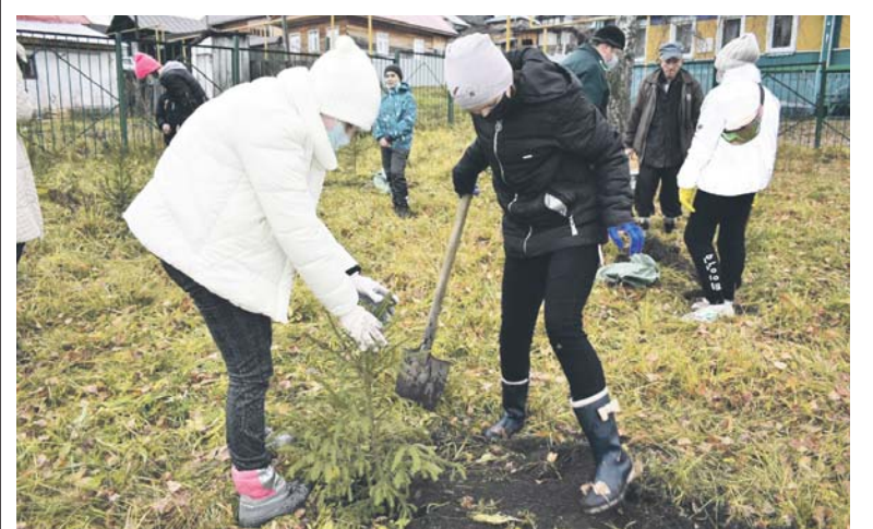
Ребята надеются, что посаженные деревца хорошо перезимуют

Алёна ЖУРЁНКОВА.