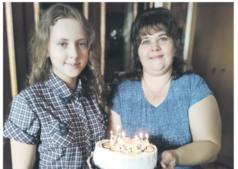
Хорошо, когда с мамой интересно всё делать вместе!

Анастасия КОРНЕЕВА.