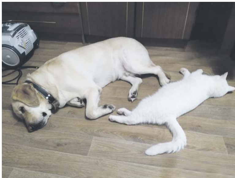
Мурзик и Нэкс — старые друзья

Ещё у нас есть белый неугомонный кот. Ему четыре года. Несколько лет назад, когда мы выбирали кота, он казался са-