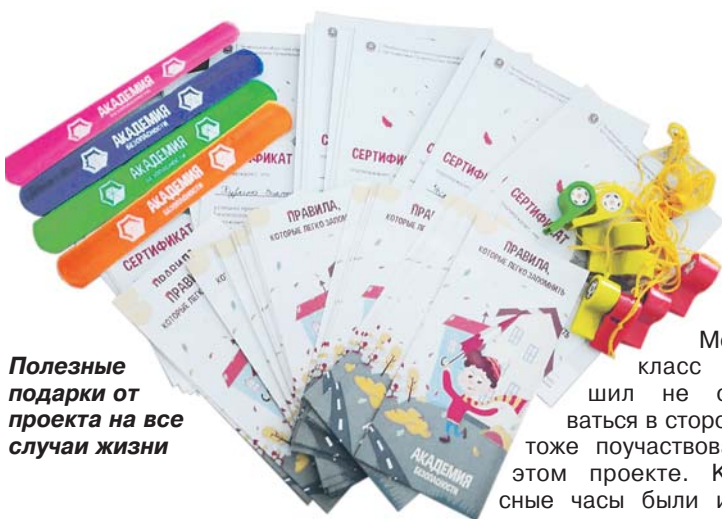
Полезные подарки от проекта на все случаи жизни

Ученики МАОУ СОШ № 7 им. Героя России А. Р. Курбангалеева стали участниками областного проекта «Академия безопасности». Для ребят провели классные часы, на которых они смогли не только получить навыки безопасного поведения в городе и киберпространстве, но также узнали, что такое буллинг и как оградить от него себя и своих одноклассников.