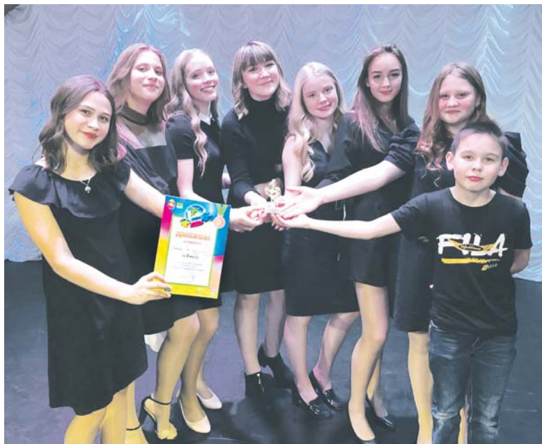
Команда «На шпильках» — призёр городских фестивалей КВН

Александра МИРОНОВА.